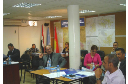
دیمنیک له توتوتوی بهکومهل له سهکوی کارمه وینه: بهشی راگهیاندنی یونامی

نووسینگه ی نه ته وه یه گگرتوه کان بۆ هه ماهه نگیی کاروباری مرۆبی (ئوچا) و ریکخراوی یونیسف سهکویکاریکی ۳ رۆژیان ( ۷-۹ تشرینی پهکه م ) له لهسهه بهرئوه بردنی کاره سات له هه ولئر نه نجامدا. نوینه رانی ریکخراوه مرۆبییه خۆمالیییهکان و "خانهکانی فریاکه و تتی حکومهت" له سهه رتاسهه ری عیراق بهشدارییان تیدا کرد.