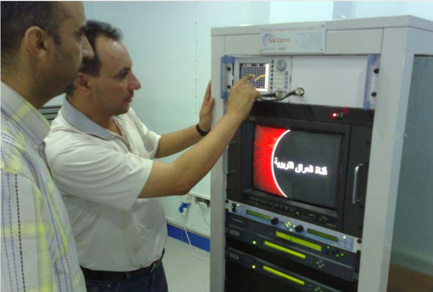
بمكارخستى بهشى پمخت

كات و شويڼه وه بشكينيټ له گه ل رمخساندنې بوار بو قوتابيان كه بتوانن دست به خوڼندن بكن و بانېش تېپه لېجنه وه. پروژه كه پېشېنه ددا به قوتابيانى قوناغه كاني ٦ و ٩ و ١٢ (پله راگوزار بيهكان).