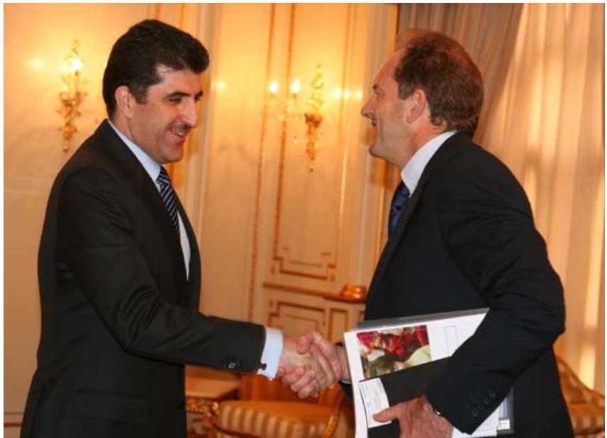
جیگری نوێنهری تایبعتی سكرتیرێ گشتیی نهمه‌وه په‌كگر توومكان دافید شیرمر له‌گه‌ڵ سه‌روکی حكومه‌تی هه‌رمیی كوردستان نچیرفان بارزانی

یه‌که‌م قوناغی ئه‌م پرۆژه‌ش بریتی بوو له کردنه‌وه‌ی خولگی راهێنایی چوار رۆژی که‌ تێیدا به‌شداران له‌لایه‌ن رۆژنامه‌نووسیکی به‌ ئه‌زمونی بواره‌که‌وه فیری ته‌کنیک و رومال هه‌لبژاردن کران. له‌م به‌شدا چه‌ند دانیشتنیکی کارکردن ئه‌نجام دران له‌سه‌ر چۆنیه‌تی هه‌لبژاردنی بابته‌ی له‌بار و چۆنیه‌تی ئه‌نجامدانی چاوپێکه‌وتن له‌گه‌ڵ به‌شداران و فیرکردنی ئه‌و ریکایانه‌ش که ده‌بنه مایه‌ی ده‌سته‌به‌ربوونی پێوه‌ره‌کانی رومال هه‌لبژارژدنی وه‌ک هاوسه‌نگی و دروستی و رومالی.