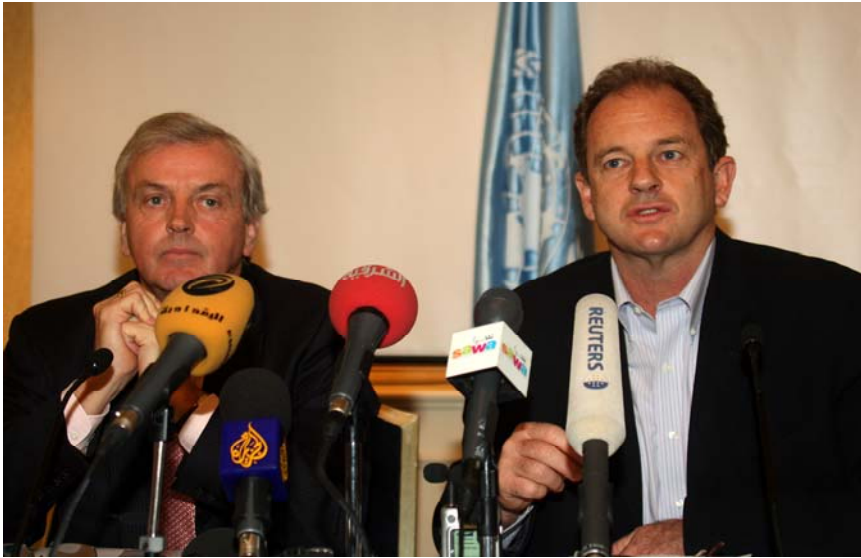
نائب الأمين العام جون هولمز ونائب الممثل الخاص للأمين العام للأمم المتحدة في العراق ديفيد شيرار أثناء المؤتمر الصحفي في عمان