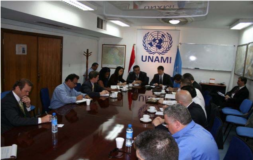
المشاركون في اجتماع الطاولة الممتدرة الدولي للشؤون التشريعية