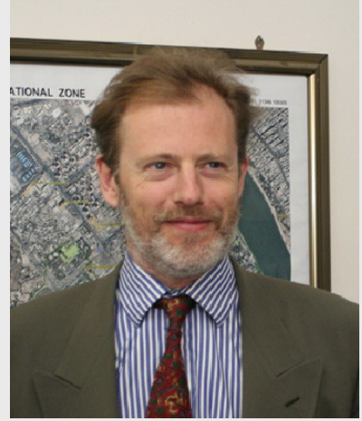
المسيد أندرو غيلمور مدير مكتب الشؤون السياسية