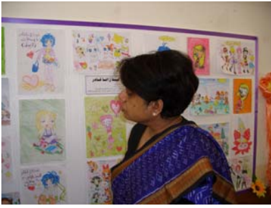
الممثلة الخاصة للأمين العام للأمم المتحدة تزور معرضاً لرسوم الأطفال