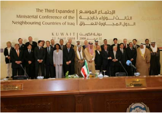
الاجتماع الوزاري الموسع الثالث لدول جوار العراق