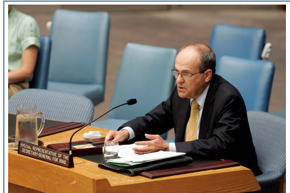
نوینهری تایبهتی سکرتری گشتیی نه ته وه یهگرتووهمکان بو عیراق ئاد میلکهرت له کاتی وتارکهدا له بهرده م نهجومه نی ئاسایشی نه ته وه یهگرتووهمکاندا