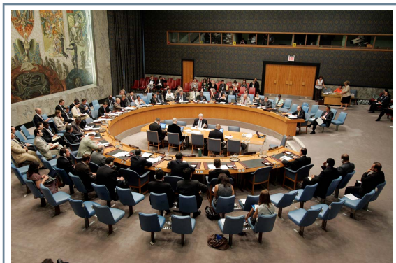
نجومه نی ئاسایشی نه ته وه یهگرتووهمکاندا

له مهش زیاتر، ئه و ئه وهشی نهشارده وه که پێشینه کاره که ی له ناو هه مو ئهوانی تر دا بریتی ده بێت له دلنیا بوون له وه ی که ئه و یارمهتییه ی له لایهن نه ته وه یهگرتووهمکانه بو گه شه پیدان دراهه به تهوای هاوریکه له گه ل "پلانی نیشتمانی عیراقی" و وتیشی "چوارچیه ی یارمهتی گه شه پیدانی نه ته وه یهگرتووهمکان بو سالهکانی ۲۰۱۱-۲۰۱۴ له سه ر بنه مای پێشینه کاره کانی "پلانی نیشتمانی عیراقی" داده مزریت به جه ختکردنه وه له سه ر تواناسازی و شایانی باسیشه که ره شنوسی کۆتایش له کۆتای ئه مسالدا ته و او