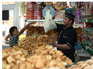
منداڵێکی عێراقی کە لە رەمەزانددا پاقلاو دەگرت