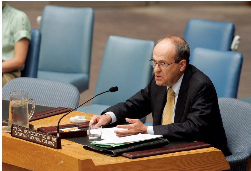
نوینەری تایبەتی سکرێتیری گشتیی نەتەوە بەهێگر توو هەکان بۆ عێراق ئاد میلکەرت لە کاتی وتارەکەیدا لە بەردەم ئەنجومەنی ئاسایشی نەتەوە بەهێگر توو هەکاندا (وینەیی نەتەوە بەهێگر توو هەکان / جینی رۆگیت)