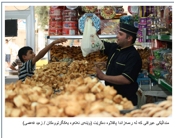
منداڵیکی عيراقی که له رهمهزاندا باقاره دهگرت