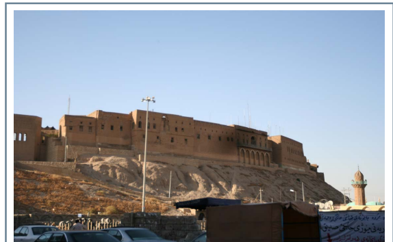
دیبه‌نێکی تری قه‌لای هه‌ولیر له‌ لای راسته‌وه

به‌م جوژه‌ ئەم قه‌لایه‌ له‌ به‌ر گه‌رنگیه‌كه‌ی له‌ لایه‌ن هه‌ردوو رێكخراوی یونسكو و سندوقی شوێنه‌واره‌ی جیهانی ئەمه‌ریکیه‌وه به‌ به‌كێك له‌ ۱۰۰ شوێنه‌واره جیهانییه‌كان هه‌ژمار كرا كه‌ پێویسته