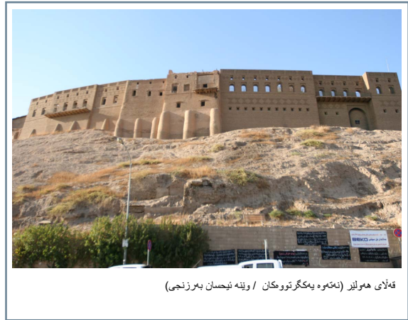
قه‌لای هه‌ولیر

له‌ ساڵی ۲۰۰۸ یه‌شدا رێكخراوی یونسكو و حكومه‌تی هه‌ریمی كوردستان كه "لێژنه‌ی نوژنه‌كردنه‌وه‌ی قه‌لای هه‌ولیر" نوینه‌ربه‌ته‌ی ده‌كرد یادداشته‌كه‌ی پێشوو‌یان هه‌مواركرد. ئەم گۆژمه‌ تازه‌یه‌ی له‌ لایه‌ن حكومه‌تی هه‌ریمی كوردستانیشه‌وه بۆ ئەم پڕۆژه‌یه‌ دا‌بین ده‌كریت بریتیه‌ له‌ ۱۴۷۵۰۰۰ دۆلاری ئەمه‌ریکی.