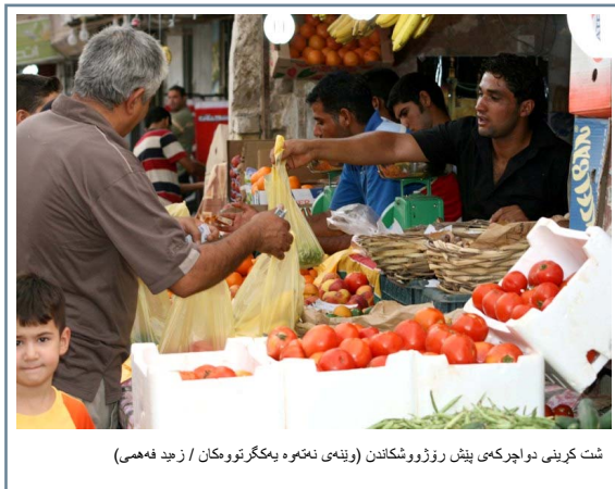
شت کرینی دواچرکەمی پێش رۆژووشکاندن (رۆبەمی نەتەو یەکگرتووەکان / ژبە فەھمی)

ئەنجومەنی گشتیی نەتەو یەکگرتووەکان ئەمرۆی تەرخان کرد بۆ تیشکخستەسەر دۆخی مەرویی لە جیھاندا لەگەڵ بەرزراگرتنی یادی ئێوانەش کہ لە کاتی پێشکەشکردنی کۆمەکە مەروییەکان بۆ