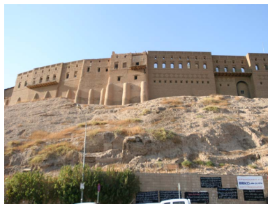
قەلای هەولێر (نەتەوە بەهێگر توو هەکان)