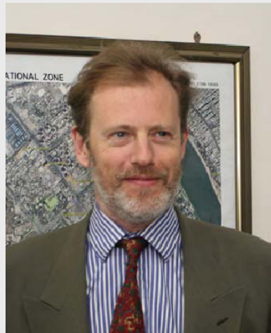
به ریز نەندرو گىلمور، سه ره وكى نوسىنگەى سیاسى

چاوپێكهوتن له گه ل به ریز نەندرو گىلمور، سه ره وكى نوسىنگەى سیاسى