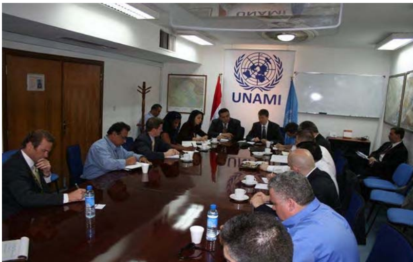
بشدارانی ششمین میزگردی جیهانی یاسادانان

میزگردی جیهانی یاسادانان، که بونامی له سر پر شتیکردنیدا هاوبه شه، سه کویه کی ناستی کارکردنه بؤ نوینه رانی بنکه له به غدای کومه لگای نیوده ولته ی و له تشرینی دووه می ۲۰۰۷د له لایه ن نوسینگی پشگیری ده ستوری سر به نه ته وه په ککرتووه کان په ره ی پیدرا له گهل هاوبه شه جیهانی کانینان و ریکخواه ناحکومیه کان، به کومیسونی نه وروپیشه وه. میزگردی جیهانی یاسادانان سه کویه کی دروستکرد که تیندا دوو هه فته جارنک گفتوگوی قول نه انجام ده دریت و نالوگوری زانیاری په ره سندنه یاسایی و دستوری یه کان دهر به ره ی بابه تگه لی پشتر ناماده کراو ده کړیت. له کاتی گونجاودا، به پی پی پهرموی ناوخو، نوینه رانی عراقی و لایان شاره ایانی عراقی ناماده بؤ پښکس شکردنی بابه تی په یوه دندیدار بانگهیشت ده کړین. به رپرسی نوسینگی پشگیری ده ستوری