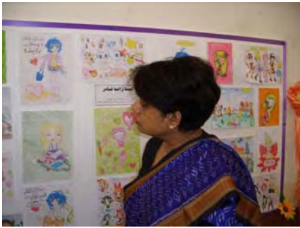
نوینهی سکریتیری گشتی نهتهوه یهکگرتوهکان سهردانی پیشانگی مندالان دکات