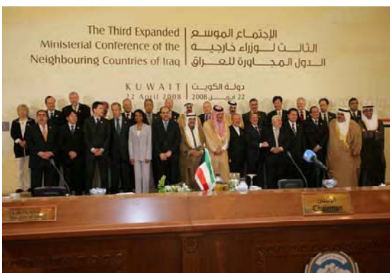
سێهەمین كۆنگرهى فراوانى وهزىرانى وڵاتانى دراوسى عىراق

وەكلى سكرتێرى گشتى نەتەوەى یەكگرتووەكان بۆ كاروبارى رامىارى لىن پاسكۆ پابەندى نەتەوەى یەكگرتووكانى بۆ عىراق دووپات كردهوه له سێهەمین كۆنگرهى فراوانى وهزىرانى وڵاتانى دراوسى