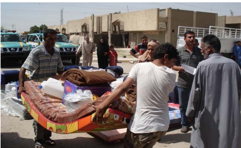
کۆمیسینیۆنی بالای پناه‌ه‌نده‌کانی سه‌ر به‌ UN کەل و پەلی ناخۆراکی دابه‌ش ده‌کات

یه‌ک له‌ ریکخراوه سه‌ره‌کیانه‌ی سه‌ر به‌ نه‌ته‌وه یه‌گرتووه‌کان که‌ خزمەتی پێشکەش ده‌کرد کۆمیسینیۆنی بالای پناه‌ه‌نده‌کانی سه‌ر به‌ نه‌ته‌وه یه‌گرتووه‌کان بوو که‌ ریکخراوێکی پناه‌ه‌نده‌بیه و زۆر چه‌خت له‌سه‌ر دروست‌کردنی خانوهه به‌شه‌ر رماوه‌کان ده‌کاته‌وه بۆ نه‌وه‌ی خه‌لکه‌کان بتوانن له‌ ماله‌کانیان ژبان به‌ سه‌ر به‌رن. نوینه‌ری کۆمیسینیۆنی بالای پناه‌ه‌نده‌کانی سه‌ر به‌ نه‌ته‌وه یه‌گرتووه‌کان به‌رێز دانیال ئەندریس ووتی "کاری به‌ پله‌ له‌ هه‌موو لایه‌که‌وه پێویسته به‌ تاییه‌ت بۆ یارمه‌تیدانی خه‌لک بۆ نه‌وه‌ی بتوانن له‌ ماله‌کانیان به‌ینه‌وه و ناو‌اره نه‌بن." کۆمیسینیۆنی بالای پناه‌ه‌نده‌کانی سه‌ر به‌ نه‌ته‌وه یه‌گرتووه‌کان له‌ گه‌ل ۳ هاوبه‌شکاری عێراقی ۲۰۹ خانوویان له‌ گه‌ره‌که‌کانی شو‌عه و سه‌در دروست کرده‌وه سه‌ره‌رای ئەو خانووانه‌ش که‌ پێشتر نوژنه‌ کرابوونه‌وه. هه‌ولێ هاوبه‌شانه‌ی کۆمیسینیۆنی بالای پناه‌ه‌نده‌کانی سه‌ر به‌ نه‌ته‌وه یه‌گرتووه‌کان بریتی به‌ له‌ کار کردن له‌سه‌ر ۱۰۰۰ خانووی