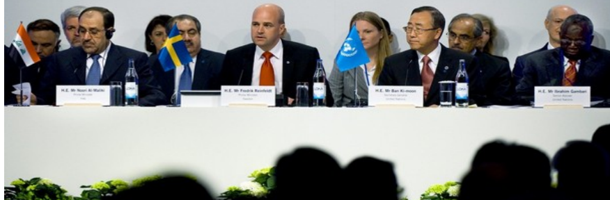
سكرتیری گشتی نەتەمە بەگرتووەكان ھاوبەشەنە سەر بەر شتی كۆنفرانسی گروپی راویژ كاری ریکەوتنامەیی نیودەولەتی لەسەر عێراق دەكات

بۆ گفتوگۆیەکی ھەرمیمی بنیاتنەر و ھەر وھا بۆ گونجاندنی شیوازی بازرگانیی لە پێناو سەر لەنوێ چوونە ناو رێكخراوی بازرگانیی جیھانییەو ھە عێراق دەیسەلمێنێ کە بە توندی بریاری داوہ کە گرژییەکان نەھێلێ و پەرەش بە ئامانجە دیپلۆماسی و سیاسییەکانی بەدات لە ریی ھاوکارییەکی بەھیزی ئابووری ھەرمیمی و جیھانیی.