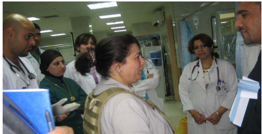
بەرپرسیانی ریکخراوی تەندروستی جیهانی سەردانی نەخۆشخانە فیترکاری به عەدا دەکەن

حکومەتی عێراق بۆ ئەوهی پێشنیار مەکی سەبارەت به هاوبەشکاری تازه بۆ گەشەپێدان نامادەیی خۆی نیشاندا کە دەست به پرۆژییەکی هەمە دارایی بکات و داوایش له کۆمەكەخەشەکانیش بکات بۆ ئەوهی رێ بێدن به بەکار هینانی سەر چاوه داراییهکانی بۆ