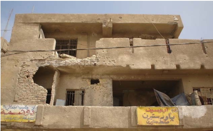
خانوهه رماوه‌کانی شاری سه‌در

ریکخراوه نەگ هەر تەنها گەرنەگە و بەس بەلکۆ و پێویستیشە.