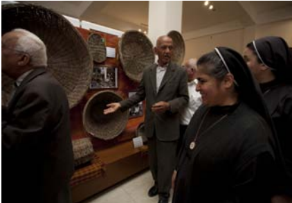
تەناتەت بچووكترين شتى ژيانى رۆژانەي عەنكاش نېبە كە لەم موزەخانەيدا نەبەت، ھەر شتىك چەند بچووكيش بېت وىنەيەكى كۆنى لەگەل دانراو كە بەر ھەمە دەستكردەكانى ژيانى رۆژانە نېشان دەدات.