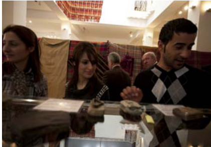
لە كۆنەھە بۇ تازە، لە مېژووبەھە بۇ سادەي، ميوانەكان ھېچ وردەكار بېكە نايۇتېرن.