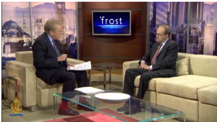
نوینەرى تايەتى سكرتيرى گشتیبە نەتەوه يەكگرتوومەكان بۆ عيراق ئاد مئلكەرت لە بەرنامەى "فرۆست لە گشت جیھان" (Frost Over the World) ی كەنالی ئەلجەزيرە ديبتە ميوانى بەريز داڤید فرۆست

سیر دەفید فرۆست: لەكاتێكدا جیھان چاوى بریوتە وەلاتانى وەك لیبيا و سوربا و يەمەن، عيراقيش لە كۆتايى مانگى شوباتى رابردووه نازەزايەتیبە تیدا ھەبوو، بەلام جياواز لە شوبنەكانى تر عيراقیبەكان خوازيارى گۆربنى رژيم نەبوون بەلكو داواى دەرفەتى زياترى كار و كەمكردنەوهى گەندەلى و ئاستىكى باشتري ژيان و، پيم وايە، تەناھيشيان دەکرد. ھاوكت، بريار وايە تا كۆتايى مانگى كانونى يەكەمى ئەمسال ئەميرىكا تەواوى ھيژمەكانى لە عيراق بکيشيتەوه بەلام ھەندىك دەلین جارى ولات نامادى ئەم ھەنگاوه نيبە. ئەرى بەراست