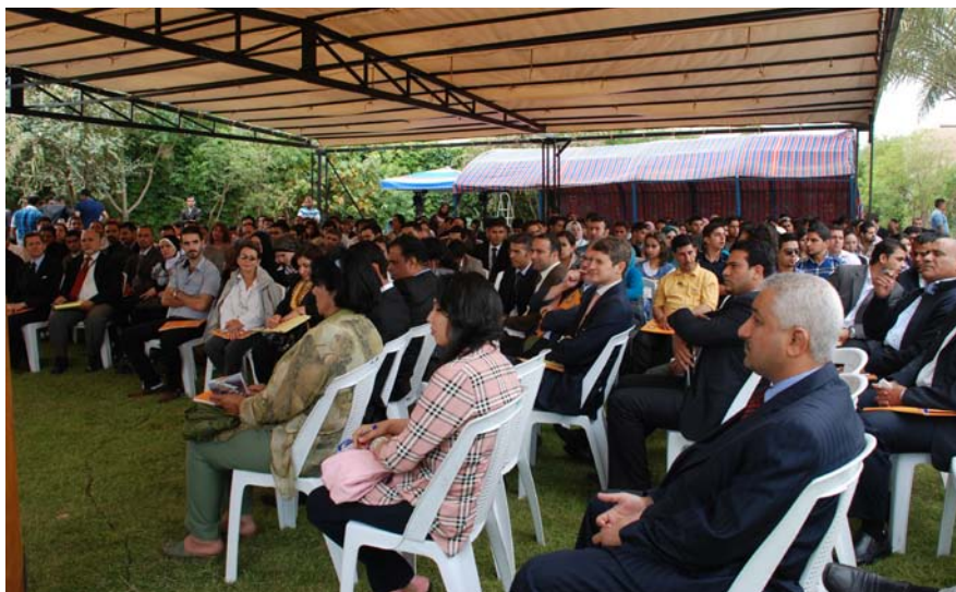
كونفرانسكه حكومت و كوملگه مدهنى بهمهكوه كوكردهو بو گوگرتن و تاوتوكردنى نمو گرفتانهى توشى گنجى عراق دهين(وينه): كنهالى تلمغز يونى سپينس تون)

له ريگهه ههوله هاوبهشهكانى ولات و كهترى تاييهت و كوملگه مدهنى.