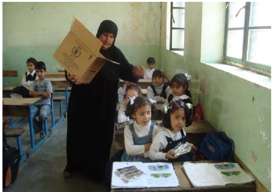
دابەشکردنی پەسکیی ھەمەخۆراکی بۆ مندالانی عیراق

بۆ ئەم مەبەستەش داواي لە ریکخراوی خۆراکی جیبهانی کرد یارمەتی بدات لە بەدرێژخایەنکردنی ئەو بەرنامە راکوزارییە، کە سەرچاوە و سەرپەرشتیکردن و خاوەندارییەتەکەیی نیشتمانی.