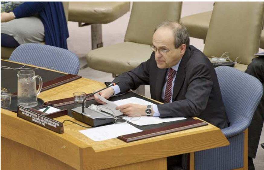
نۆ‌ینە‌ری‌ تاییبە‌ت‌ س‌کر‌تێ‌ری‌ گ‌شتی‌ نە‌تە‌و‌هە‌ یە‌گ‌ر‌ت‌و‌ه‌کان‌ بۆ‌ ع‌یر‌اق‌ ئاد‌ می‌ل‌کە‌رت‌ ک‌ور‌مە‌ی‌ک‌ ل‌س‌ەر‌ کار‌ی‌ یونامی‌ و‌ پ‌ەر‌ه‌س‌ند‌نە‌کانی‌ ئە‌م‌د‌واییە‌ی‌ ع‌یر‌اق‌ دە‌داتە‌ ئە‌نج‌ومە‌نی‌ ئاسایش.