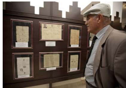
... ھەر دىكومېنتىك لە موزەخانەي كەلەپورى سريانى چيروكى پەكېك لە رازاوتىرى كەلتورى ناو كەلتورى ھەمەجۆرەكانى عىراق دەكېز نەھە.