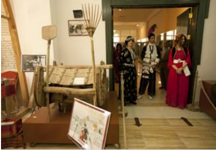
خۇنامادەكردن بۇ پېشوازي ميوانەكان: كوردنەھەي موزەخانەي كەلەپورى سيريانى لە ھەرلېز بۇنەيەكى زۆر گرنگە بۇ كرېستانەكان ناوچەكە كانمەندانى موزەخانەكە بە جلى رسەنى خۇمالى بەخىزەھاتنى ميوانەكان دەكەن