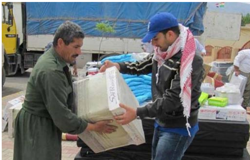
یارمەتیەکانی "ریکخراوی کۆچی جیهانی" دەرگە ئەو ناوچانە ی توشی لافاو بوون

"ریکخراوی کۆچی جیهانی"، بە هەماهەنگی لەگەڵ ریکخراوی یونیسف و کۆمیساریای بالای نەتەوه یەکگرتووەکان بۆ پەنابەران، هەر یەکسەر لە رۆژی ٢٦ ی نیسان کەوتە گەیانەندی پێویستیەکان و دایەشکردنی یارمەتی بەسەر ئەو ٢١ خێزانە. خێزانەکان لە کۆگای کۆتیری "ریکخراوی کۆچی جیهانی" سیسەم و سەری و کەلوپەلی پلاستیکی و سۆبە ی گازیان وەرگرت. لەلایەکی ترەوه، ریکخراوی (یونیسف)یش، وەک بەشێک لە هەماهەنگییەکی لەگەڵ "ریکخراوی کۆچی جیهانی" دا، کەرەسە ی خاوینراگرتنی دابەش