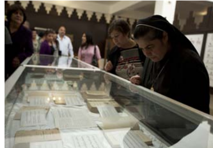
دەسنوس و دىكومېنتى سريانى و نوسخە ئەسلىيەكانى ناو سندوقە شۆشەكان بۇ سەبەكردن دانراون...