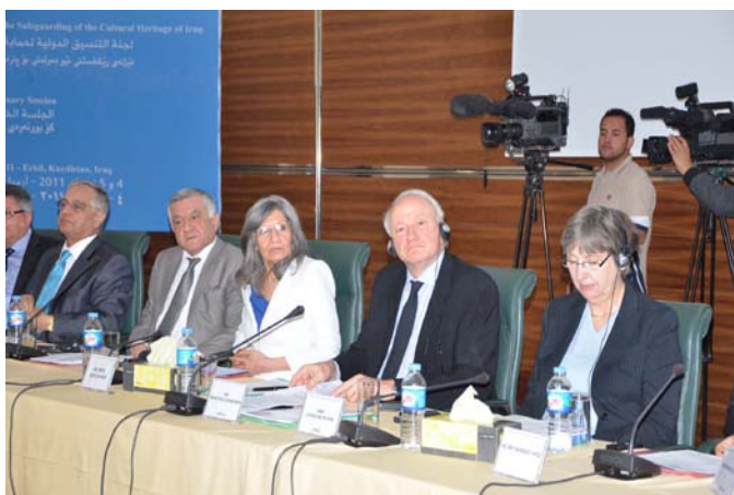
کردنەوهی پینچەمین دانیشتنی پرنەندامی "لێژنەیی جیهانی هەماهەنگسازی"ی عیراقی که بۆ یهکهەمسجاره له عیراق ریکخبریت

بارمەتیدەری بەرئوبهیری گشتی ریکخراوی یونسکو بەرێز فرانسيسکو باندارین نامادەیی کۆبوونەوهکهی بوو و وتی "پینوسته ئاوهاندنەوه و