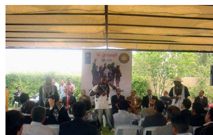
خلكى گنج لهسهرتاسهرى عراق ههلى نامادهبوونيان له كونفرانسكه دهقوزنهوه بو نهوى دهنگيان بيبسترى

كونفرانسى لاوان وهك كوژرى راويژكاريه كراوه