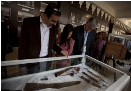
لە چەكەھە بۇ كامبىرا و بۇ بووكەشوشە بۇ مەندالە بچووكەكان، ھەر تاكە شتىك بەشارىي دانىشتوانى عەنكاهە نېشان دەدات.