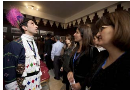
سالتىكى راباردن و پېكەنن...