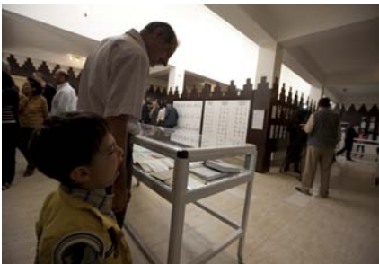
...و كاتىكى ھىلاكېش.