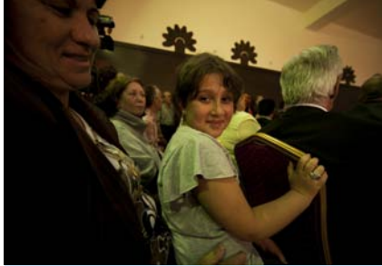
ئەم ھۆلە بچووكەي پر لەميوان كە تېيدا بەرئۆبەري موزەخانە و ميوانە بەرئىزەكان و تارەكانى كوردنەھەي تېد پېشكەشكرد پر ميوانە.