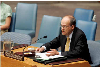
نێ‌ردە‌ی تایبە‌تی س‌کر‌تێ‌ری گ‌شتی نە‌تە‌وه‌ یە‌ک‌گ‌رت‌وه‌کان بۆ ه‌او‌کار‌ی‌کرد‌نی ع‌یر‌اق ناد مێ‌لک‌ه‌رت و تار‌یک د‌م‌خ‌و‌ن‌ن‌تە‌وه‌ لە‌نجومە‌نی ناسایش له‌ ۴ی ناب‌ی ۲۰۱۰.

مێ‌لک‌ه‌رت وتی کە‌ داکۆ‌ت‌ن له‌ پ‌یک‌ه‌ینانی حکومه‌ت‌دا کاری کرد‌وه‌ ته‌ سەر ژ‌یر‌خانی بنه‌رە‌ت و