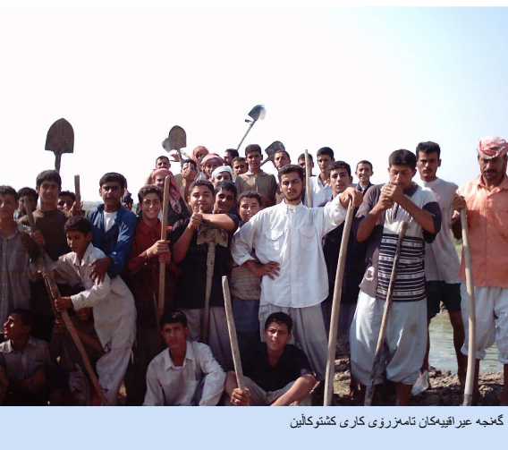
گه‌نجه‌ عیراقیه‌کان تاسه‌رۆی کاری کشتوکاڵین

عیراقی له‌ رووی په‌روه‌رده‌ و فیکردن و کارکردن و وه‌رز و هونه‌ر و، به‌شداربیکردنی کۆمه‌لایه‌تی و سیاسییان له‌سه‌ر لاپه‌ری راستیه‌یه‌کانی گه‌نجان عیراق ده‌ستده‌که‌وینت.