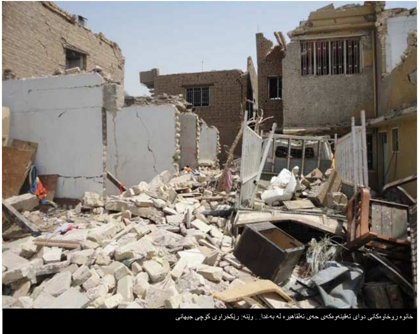
خانووە روخاومکاتی دواي تەقینەووەیی حەیی ئەلقاھیرە لە بەغدا .

بۆ زانیاری زیاتر تکایە پەیوەندی بکە بە لە ماسیو گرێدۆن لە ریکراوی کۆچی جیهانی لەسەر ناوینشانی mgraydon@iom.int