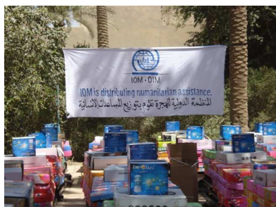
کەلوپەلی فریگوزاری لە لایەن ریکراوی کۆچی جیهانی دابەشکرا بەسەر ٤٥ خیزانی لێقەماری تەقینەووەیی بەغدا