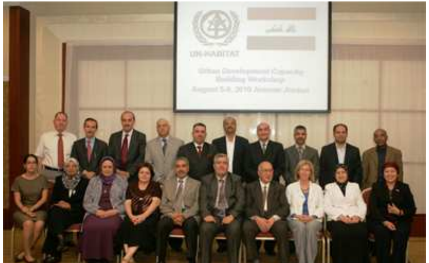
بهرنامه جهرانی عیراقی له راهینانی له UN-HABITAT عه ممان، ۵-۷ ی ئابی ۲۰۱۰.

کارمهنده په یه ونداره کانی نهم و مزارمتانه. ههروهه که به رتیه بهری گشتیی پلاندانی فیزیکی د. موجه ممد شابه ندر نامازه ی پیکرد، پنیوستیه کی زۆر بۆ به هیزکردنی توانای پلاندانهرانی شاری له عیراقدا ههیه. نهم به رتیه به ره گشتیه و تیشی "له ئیستادا تنه ها ۷ پلاندانهری شاری شاره زا هه نه که له به عداد کار ده که له گه ل ۷ ی تریش له پارێزگاکانی تری عیراقدا". له مه سه کۆیکاره شدا پلاندانهرانی شاری که له ولاته کانی هیند و مالیزیاوه هاتبوون نه زمونه کانی ولاته کانیا له گه ل هه وتا عیراقیه کانیا دا هاوه ش کرد بۆ دامه زانانی "ده زگای پلاندانه رانی شاری" ی پرۆفیشنال. ههروهه ها، سه کۆیکاره که سهردانی "ده زگای گه شه پیدانی شاری له عه مان" یشی گرته خۆی که بریتیه له خانه یه کی هه ریمیه که ته رکیز ده کاته سه ر به رتیه بردنی شاری و پلاندانانی کۆمه لگه و گه شه پیدانی درژخایه نی کۆمه لگه.