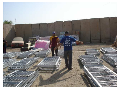
کەلوپەلی فریگوزاری لە لایەن ریکراوی کۆچی جیهانی دابەشکرا بەسەر ٤٥ خیزانی لێقەماری تەقینەووەیی بەغدا