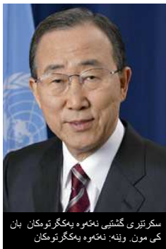
سکرته‌ری گشتیی نهمه‌وه‌ په‌گرتووه‌کان بان کی مون.

ژنیکی ته‌مه‌ن ۳۰ ساڵه‌، ریکخراویکی عیراقی، رۆژه‌لاتی عیراق: "من شانازیم به‌خۆم کرد ئه‌و کاته‌ی که توانیمان یارمه‌تی ژماره‌یه‌ک له‌ ژنی هه‌زار بده‌ین و که توانیمان جلوبه‌رگ بۆ مندا له‌کانیان دابین بکه‌ین له‌گه‌ل پێشکه‌شکردنی ژمه‌ خواردنیکی هاوبه‌ش بۆیان."