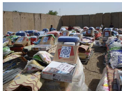
کەلوپەلی فریگوزاری لە لایەن ریکراوی کۆچی جیهانی دابەشکرا بەسەر ٤٥ خیزانی لێقەماری تەقینەووەیی بەغدا