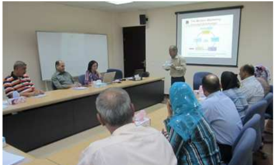
راهینانی ریکراوی UNIDO موخا ره له سه سر بیرو که کانی بازاری نوی دهقیته وه.

بۆ ته واوکردنی ده سکه وته کانی" په ره دانی وه به رهینانی گه شه پیدانی پرۆژه ی ریکراوی یونیدۆ"ش له عیراقدا، "که شه پیدانی پرۆژه له ریگه ی تکنۆلۆژیای په یوه ندیی و زانیاری ریکراوی یونیدۆ" ده یه ویت راهینانی سه رهیل و ناھیلی به ۵۰۰ بازرگان بکات و راهینانه کانی له جه مسره تکنۆلۆژیایه ده ست ده کمون که له لایه ن ده زگا خانه خۆنیه کانه وه دادمه زرین.