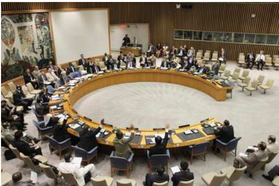
دیمەتیک‌ی فراوانی نەنجومەنی ناسایش لە کاتی پەرە‌س‌کرد‌نی کۆ‌ده‌نگ‌ی بریار‌ی ۱۹۳۶ (۲۰۱۰) م‌او‌ی مان‌دیت‌کە‌ی یونامی تاک‌و ۲۱ تە‌م‌وزی ۲۰۱۱ درێژ‌ک‌را‌وه‌.

لە دانیش‌تنی رۆژی ۵ی ئاب‌دا لە بارە‌ گ‌ای سەر‌ه‌ ک‌یی نە‌ تە‌ وه‌ یە‌ک‌گ‌رت‌وه‌کان لە نی‌ویۆرک، ئە‌ندامانی ئە‌نجومە‌نی ناسایش بریار‌ی یە‌ک‌ س‌ال درێژ‌کرد‌نە‌وه‌ی مان‌دیت‌ی (یونامی) یان دا کە‌ به‌ هە‌ ولە‌ ک‌انی بە‌ رده‌ وامه‌ له‌ یارمە‌تیدانی ع‌یر‌اقییه‌کان بۆ دروست‌کردنی ولات‌یک‌ی ئارام و دیموک‌رات و خۆ‌ش‌گ‌وزە‌ران.