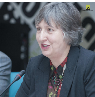
جیگەری نوێنەری تایبەتی سکرێتیری گشتیی نەتەو بەیگرتوووەکان بۆ ھاوکارکردنی عێراق/ رێکخەری مەرویی و جێبەجێ خاتو کریستین ماکناب لە کۆنفرانسی کازا نەبە لە ٢٤ ئای ٢٠١٠.

کاری مەرویی مسۆگەر دەکەن و زۆر گرتگیشتن بۆ دامەزراندن و پەردان بە دەستگرتن بە خەلکی بەرکەوتە و پێویستیشە لە لایەن پەیوەندارانەووە رێزبان لێ بگێرن.