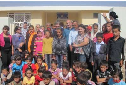
جیگرى نوینەرى تاییهتى سكرتیرى گشتی نەتەوه یەكگرتوو هەكان بۆ هاوكاریكردنى عیراق خاتو کریستین ماكناب سەردانى گوندى سوتكە لە سولەیمانى دەكات.

لەسەردانەكەى ئەم دوایه‌ى بۆ كوردستانى عیراق، جیگرى نوینەرى تاییهتى سكرتیرى گشتی نەتەوه یەكگرتوو هەكان خاتو ماكناب لە ١٨ ئابدا سەردانى قوتابخانەیهكى قورى كرد لە گوندى سوتكەى پارێزگای سلیمانى. ئەو قوتابخانە چوار پۆلییه لە لایەن ریکخراوى هاوبەتانه‌وه دروست كرابوو لەچوارچێوه‌ى ئەو پرۆژانەى كە بە هاوبەشكارى لەگەڵ ریکخراومەكانى یونیسێف و یونیسكو و تەندروستى جیهانى و یونیسفام و لە سەر ئەركى دارایی "فەندى مەمانەى عیراق" جێبەجێ كرابوون.