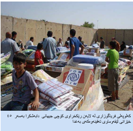
کەلوپەلی فریگوزاری لە لایەن ریکراوی کۆچی جیهانی دابەشکرا بەسەر ٤٥ خیزانی لێقەماری تەقینەووەیی بەغدا

هەر ئەو ئیوارەش کەلوپەلی یارمەتی لە کۆگای