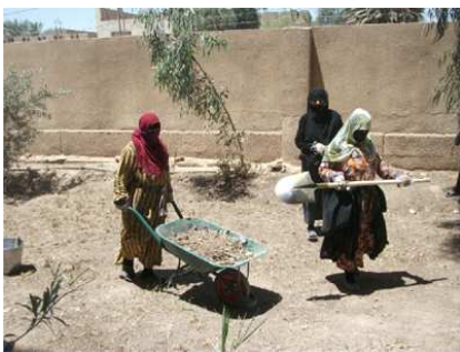
دروستكردنەوى بالاخەمى گشتى. وێنە: ریکخراوى خۆراكى جیهانى

ریكخراوى خۆراكى جیهانى نەتەوه یەكگرتوو هەكان بێكارى كردووتە نامانج لەو ناوچانەى عیراق كە بە توندی تووشى توندوتیژی و نانارامى هاتوون لە رێگه‌ى فراوانكردنى بەرنامەى "كار بە پارەى نەخت" بۆ ئەوهى بگاتە زیاتر لە ١١٠٠٠ خەلكى بێدەرامەت و یارمەتیشیان بەدات ژبانی رۆژانه‌یان داڕێژى بکەن.