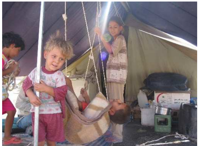
مندا له عیراقیه‌کان له کامه‌کی ناواره ناوخوییه‌کان.

ناژانسه‌کانی هاوکاریکردن خۆراک، و ته‌واوکه‌ری