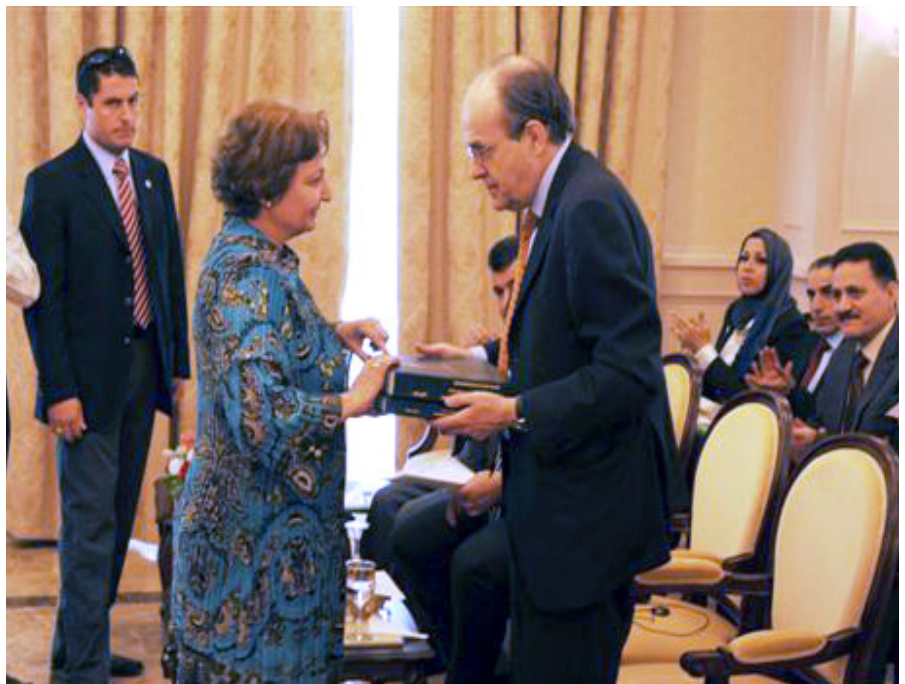
بهونهی یادکردنه وهی رۆژی دانیشتوانی جیهانی له بهغدا پایتهختی عیراق له ۱۱ی ته مموزی ۲۰۱۱، نوینهری تاییهتی سه کرتیری گشتی نهتهوهیهکگرتوهکان بۆ عیراق ئاد میلکهرت راپۆرتی ۲۰۱۰ی کۆمسیۆنی نیشتمانیی دانیشتوانی عیراقی سه بارهت به دۆخی دانیشتوانان له ولات وهرگرت

راپۆرتهکه به ناوی "باری دانیشتون له عیراق سالی ۲۰۱۰"ه و وینهیهکی سه ره تایی باری دیموگرافی له عیراق پیشان ده دات ریخۆشکهره بۆ ناماده کردنی لیکۆلینه وهیهکی گشتگری با به تیبانه که بنچینهیهکی باوه پینکراو و زانستیبانه و شیکاری و به ده سه لاتی هه بییت سه بارهت