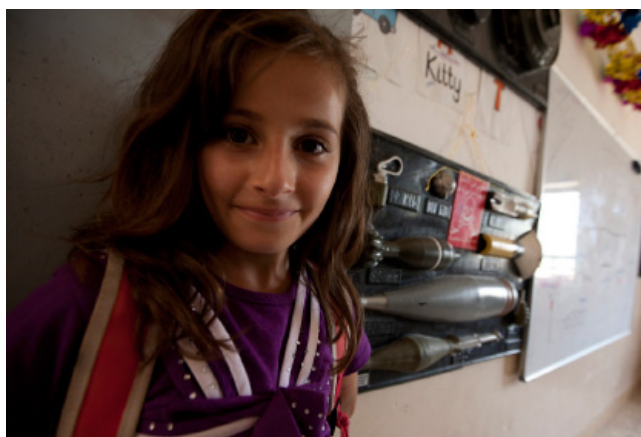
ناشاهه له پاریزگای دهوکی هریمی کوردستانی عیراق: قوتاییه قوتابخانهی ناشاهه سهرتای پهکیکه له سوودمندانیه بهرنامهی (فیزکردنی هابونهی مامرسپهکانی مین) ی ریکخراوی یونیسف له گوندی ناشاهه. دهستپیشخیرییه له لایین (بهزیویهرایمی گشتی کاری مین) و (ناژ انسی کوردستان بو مین) هوه و لهسهرتای داری (بهرنامهی پاراستنی منډال) ی ریکخراوی یونیسف جیههچیکردنی. بهرنامهکه به درزیایی پشوی هابون بهردوام دهیت کلمهش جیکر هوهی فیزبوونی جوان بو منډالان پشککش دکات.

ناژ انسی پهناهندهی سهربه نهتهوه پهگرتوو هکان (UNHCR)، بهیشتبهستن به ههلهسنگاندنی پیویستییهکان، سالی پهکجار یارمتهی نهختی دهاده خانوادهی پهناهندهکان. له ههولیزیش، نه داراییه له ریگهی (بنکهی هاوکاری پاراستنی) ی نه ریکخراوه به ههماهنگی لهگهله (ریکخراوی فریاگوزاری گشتی)، که هاوبهشکاری جیههچیکاری ریکخراوهکیه، بهریوه دهجیت. لهسالی ۲۰۱۱ شدا، ۱۳۳ خانوادهی پهناهنده له سوودیان له بهرنامهی بینیوه.