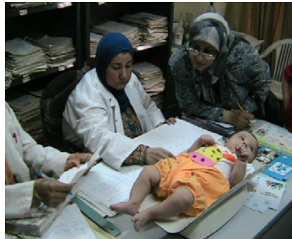
کارمەندانی وەزارەتی تەندروستی چاودێری گەشەکردنی مندائیکی عێراقی لە بەغدا دەکەن.

وەزارەتی تەندروستی عێراق داوای پشتمگیری لە ئازانسەکانی نەتەو بەگرتووەکان (رێخراوی تەندروستی جیھانی) و (یونیسف) کردووە بۆ گەشەپێدانی ستراتیژی نیشتمانی گشتەر و دانانی پلانی کار بۆ ۱۰ سالی دادبێت (۲۰۱۲-۲۰۲۱). مەبەستیش لە پلانەکە لەخۆگرتنی چەندان بواری جۆراچۆری خۆراکپێدانی دایکانە و کۆنترۆلکردنی ستراتیژی خۆراکپێدانی دایکانە و کۆنترۆلکردنی قەلەوی و ژەمەخۆراکی قوتابخانە و خەلکی خاوەن پێداوێستی تاییبەت و ئاسایشی خۆراک و سەلامەتی و کەمیی پێکھاتە خۆراکبەکان.