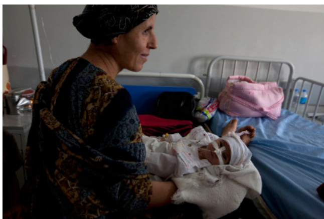
نهمدی له پاریزگای دهوکی هریمی کوردستانی عیراق: دایکک و کورپهکی له خستهخانهی نهمدین که له یونیسف (دهستپیشخیری خستهخانهی دوستی منډال) (BFHI) و راهبانی کارمندان جیههچیکردنی دکات. کاری یونیسف لهسهرتاسهری عیراقدا پشنگریکردنی حکومتی عیراقه بو پهردان بهسیاسی نوستایمی منډال و دروستکردنی توانای نه دزگابانهی که خزمی بنهرونی پشککش به منډالان دکات و کورونوه لهگهله هموو جیههچیکار مکانی نهکمان بو تیگیشتی تاوایان له مافهکانی منډالانی عیراق.

(دهستپیشخیری خستهخانهی دوستی منډالی) له لایین هردوو ریکخراوی (تندروستی جیهانی) و (یونیسف) هوه له سالی ۱۹۹۱ دهستی پیکرا بو جیههچیکردنی نه پراکتیکانهی که شیرپیدانی سروشتی دهپاریزن و گهشهیی پی دهن. ۳۲ خستهخانه لهسهرتاسهری عیراقدا له دهستپیشخیرییهدا تومار کراون. ریکخراوی یونیسف له سالی ۱۹۸۳ هوه لهولات دستبکار بووه.