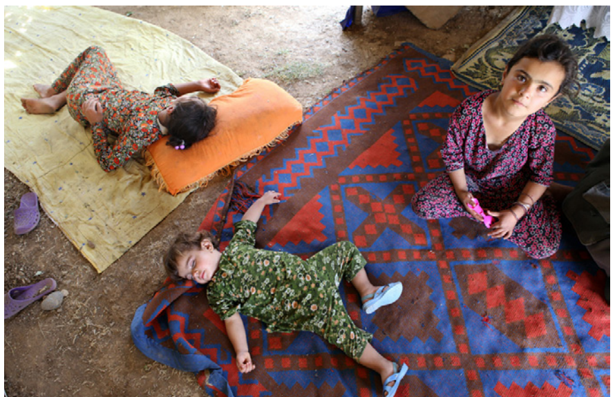
منداڵه‌ ناوارمه‌کانی عیراق له‌ گۆندی گۆجاری نزیك سنوره‌ی عیراق و ئێران.

کۆمیساریای بالایی په‌ناهنده‌کانی سه‌ربه‌ نه‌توهه‌که یه‌کگرتووهمکان چا‌ر و دۆشه‌گی پلاستیکی به‌سه‌ر ئه‌م خه‌لکه‌ دا به‌ش کردوه‌ و ریکخراوه‌ مرو‌پیه‌کانی تریش خواردن و حه‌سیر و مه‌کینه‌ی ناوپا‌لوتن و زۆیا و