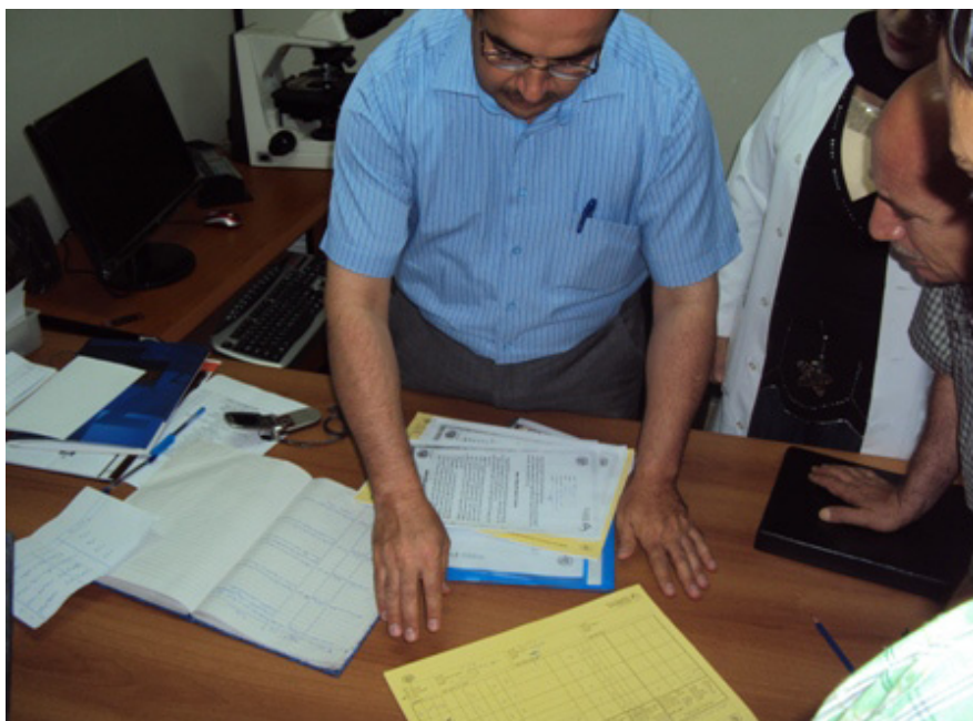
لە کاتی سەردانەکیان لە مانگی حوزەیران بۆ نەخۆشخانە نازادی لە دەھۆکی ھەرمی کوردستانی عێراق، کارمەدانی ریکخراوی تەندروستی جیھانی کارتەکانی نەخۆشی سیل دەشکێن.

بۆ زانیاری زیاتر تکایە پەیوەندی بکەن بە د. سیفیل ھوسینوفا لە ریکخراوی تەندروستی جیھانی عێراق بە ئیمیل huseynovas@irq.emro.who.int