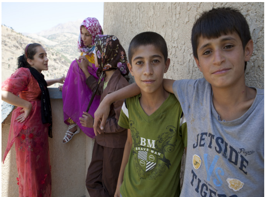
خویندکاره لاره عیراقیهکان له گوندی هه شتوی پارێزگای سلیمانی له هریمی کوردستانی عیراق و چانیک و مردمگرن له میانهی خوینکی هوشیار کردنهوهی مهنترسییهکانی مین که له لایهن بهر یوه برایهتی گشتیی کاری مینهوه له سهری نهکی دارایی یونیسف نهجامدراوه.

میلکهرت ناماز هیدا که ژماره یهک نیشاندهری پیشکهموتی گهنجان مایه ی نیگهرانین. ریژهی به شداریبوون له خویندنی ناوهندی ۲۱٪ هور ریژهی نه خویندهواری و بیکاریی گهنجانیش ناستیکی به رزدایه و له گهنجانی ته مهن ۱۵-۲۹ سال له