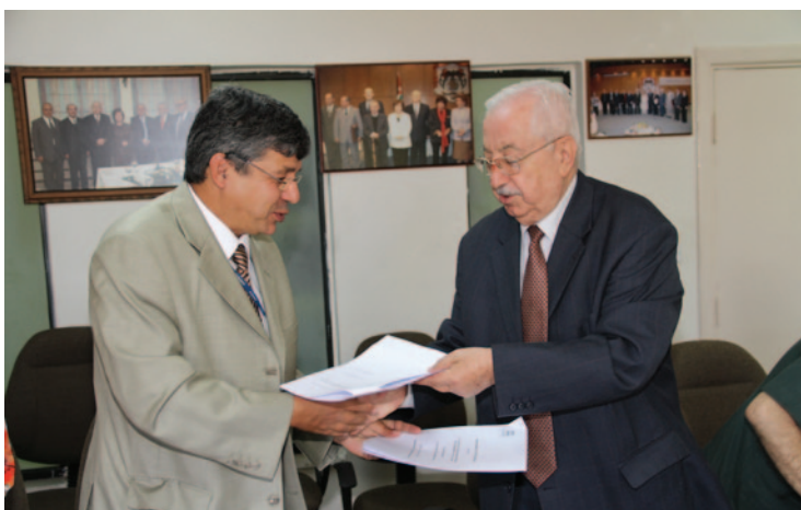
بەرپۆهەردنی یونیسکو عێراق و سەرۆکی زانکۆی فیلا دەلیای ئەردەنی یاداشتێ لیکتێگەشتن ئیمزا دەکەن.

چالاکییەکە لە ئەردەن لە رۆژانی ۲۱-۲۲ ی حوزەیرانی ۲۰۱۱ ئەنجامدرا و بوو مایە کۆکردنەوهی ۴ شارەزای جیهانی بۆ فیزیکردنی ئەلیکترۆنی کە لە ولاتەکانی فەرنسا و تورکیا و ئەلمانیا یە هاتبوون لەگەڵ تێمبکی عێراقی کە لە ۱۸ کەس پینکەتیبوون و لە ۹ زانکۆ هاتبوون بە مەبەستی دروستکردنی تێروانینێک لەسەر زانکۆ بۆ ئایندە لە عێراق.