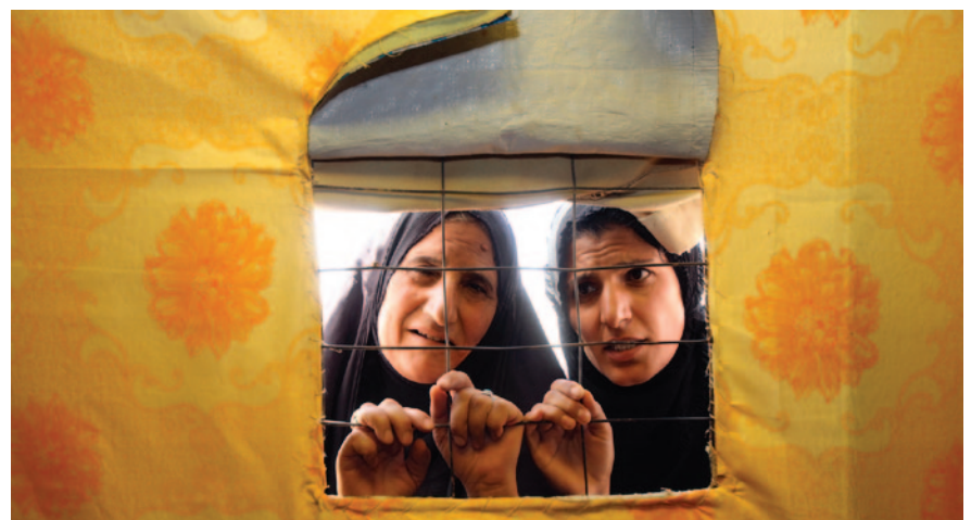
ئافرەتيكى پەنابەري فەلهستينى له كورنى خۆشهكوه له كهمپى ئەلولىد سەئودى دەراره دهكات. نهم كهمپهكه دهكۆرته نزيك سنوورى عيراق و سوريا و ئيستادا ۵۴۰ پەنابەري فەلهستينى له خۆدهكرت. ريكخراوى UNHCR ۱،۲۰۰ پەنابەري فەلهستينى له كهمپى ئەلولىد بۆ جۆرهها رالات نارودون بهسەمى نيشتەجيكرن. له كۆزى نزيكهى ۳۴،۰۰۰ پەنابەري فەلهستينى له عيراق له سالى ۲۰۰۳، ئيستاكه كهمتر له ۱۰،۰۰۰ يان له عيراق ماوون. ههروهها، كهمپى ئەلولىد ۱۷۳ پەنابەري كوردى ئيران و ۱۰۱ پەنابەري ئەموازى ئيرانيه تيندايه.

(راپورتى UNHCR لىسەر ناراسته جيهانيههكانى سالى ۲۰۱۰)، كه له رؤزى جيهانيى پەنابەران دەرچوه، ئاشكرايكرد كهوا عيراقيههكان له نيو ۱۰ نهمهوه بهكهمهكانى پەنابەرانن له سهرمتا و كوتايى نهم ده سالهيه. ههروهها نامازميدا كهوا ئيستا ۴۳.۷ مليون