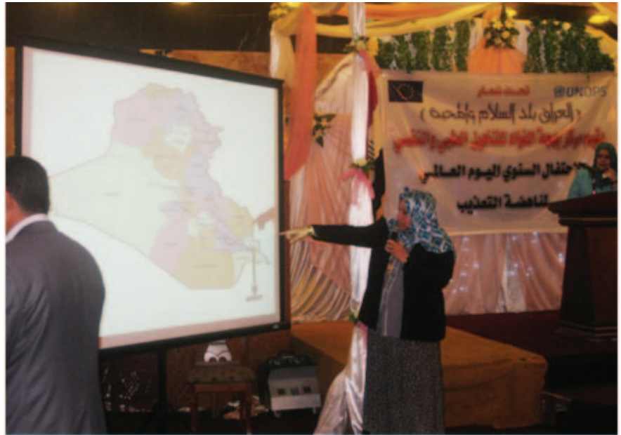
کارمەندێکی نەتەرەییەکی تۆمەکان کاری تێمی خۆناساندن سەبارەت بە پێشکەشکردن خزمەتگوزارییەکان بە قوربانیانی ئەشکەنجە لە پارێزگا نزیکەکاندا نمایش دەکات.