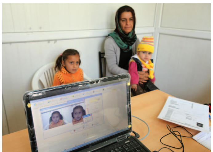
ناهرهتیکی پهنا بهری تۆرکی لهگهڵ دوو مندالهکی له کهمپی مهخموور بهنداری له پرۆسه تۆمارکردنه نوینیهکه دهکن. ۱۰.۲۴۰ پهنا بهری تۆرکی نیشتهجنی کهمپی مهخموور و زۆر باشیان له دواي شههه چمکار یهکاتی رۆژ ههلاتی باشووری تۆرکیا له سالی ۱۹۹۴ هاتوونهته عیراق. حکومهتی عیراقیش به هاوکاری UNHCR له ۲۱ ی تشرینی یهکی ۲۰۱۰ هوه دهستیان به پرۆسهی تۆمارکردنی نوێ کرد بۆ ههموو پهنا بهرانی کهمپهکه و پرۆسهکیش له ۱۹ حوزیرانی ۲۰۱۱ کۆتایی هات.

دانیشتوانی کهمپی مهخموور له سالی ۱۹۹۴ له تۆرکیا بهرمو عیراق ههلاتن.