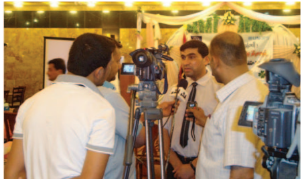
لە زیورەسی داگیرکردن لە بلدەر نامەیی رۆژی جیهانی بۆ پشتموونیکردنی قوربانیانی ئەشکەنجە، راویزکاری پزیشکی (بێکەیی ناو دادنکردنەوهی بەهەجەت ئەلفوناد بۆ قوربانیانی ئەشکەنجە) وتارێک پشتموون بە راگەیاننی ناو خۆ دەکات.

عێراق هاندراوه کاری زیاتر بکا سەبارەت بە پاراستنی مەدەنییەکانی لە توندوتیژی. ئیڤان سیمونوفی، یاریدەدەری سکرێتیری گشتی بۆ مافەکانی مرۆڤ، دەڵێ هێشتا لە عێراق سالانە ۴۰۰۰ کەس دەمرن لەمکاتیکی دەوڵەت بۆ ناو دادنکردنەوه تێدەکۆشی. ۸ سال پێش ئیستا بوو کە هاوێپەمانی چەند ولایتیک عێراقیان داگیرکرد و سەرۆکی پێشوو سەدام حوسینیان لەکار لادا. جولی وۆکەر یاریدەدەری سکرێتیری گشتی بۆ مافەکانی مرۆڤ ئیڤان سیمونوفی دەوێت سەبارەت بە گەشتە ۱۰ رۆژییەکی ئەم دواییه بۆ عێراق. ماوهی چاوپێکەوتنەکه: ۵ خۆلەک و ۱۲ چرکە