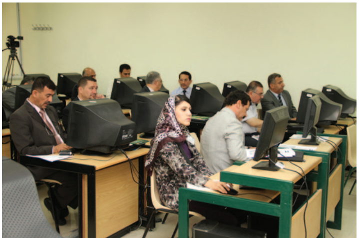
بهشاربووانی سهوکیاری کامپهسی تهنیکیی ئافیسینا که له زانکۆی فیلالفیا له نوردن له ۲۱ - ۲۲ ی حوزیرانی ۲۰۱۱ ساژکرا.