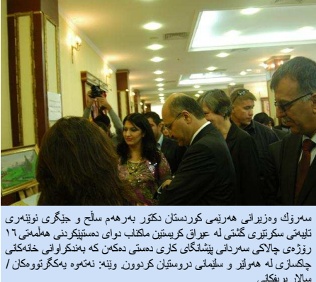
سهروک وهزیرانی ههرمی کوردستان نکۆر بهرههه سلخ و جیگری نویهری تلیمی سکریتیری گشتیی له عیراق کریستین ماکناب دواي دهستیپیکردنی ههلمهتی ۱۶ رۆژی چالاکای سهردانی پینشنگای کاری دهستی تمکن که به بندرلوانی خهکاتی چاکسازی له هویز و سلیمی دروستیان کردوون.