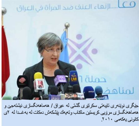
جیگری نویهری تلیمی سکریتیری گشتیی له عیراق / ههماهنگسازیی نیشتهجی و ههماهنگسازیی مرۆیی کریستین ماکناب وتیهک پینشکمش دکلت له بهغدا له ۲۵ کانونی یهکهمی ۲۰۱۰.