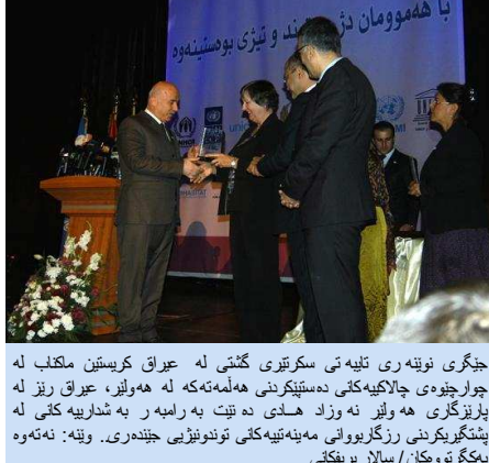
جیگری نویهری تلیمی سکریتیری گشتیی له عیراق کریستین ماکناب له چوارچۆیهی چالاکیهکی دهستیپیکردنی ههلمهتهکه له هویز، عیراق ریز له پاریزکاری هه وایز نه زواد هادی ده نیت به رامهر به شداریه کانی له پینشپیرکردنی ریزگاری مهنیهتییهکانی توندوتیژی جیندهری.