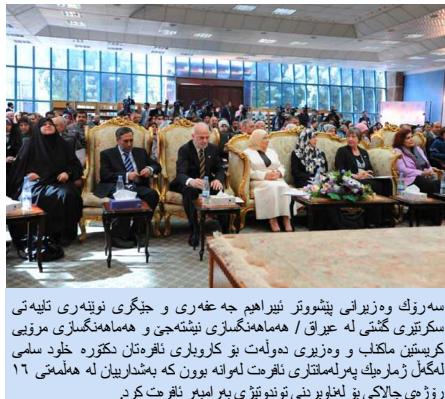
سهروک وهزیرانی پینشو نیبراهیم جهعهفری و جیگری نویهری تلیمی سکریتیری گشتیی له عیراق / ههماهنگسازیی نیشتهجی و ههماهنگسازیی مرۆیی کریستین ماکناب و وهزیری دیولهت بۆ کاروباری ئافرهتان نکۆره خلود سلمی لهگهل ژماریک پرلمنتاری ناهرت لهوانه بوون که بهشاریهی له ههلمهتی ۱۶ رۆژی چالاکای بۆ له تویرندی توندوتیژی بهرامهر ناهرت کرد.