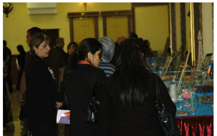
پنشیانی کاری دهستی دهکن که به نکرانی خهکته چاکسازی له ههولێر و سلیمانی دهستان کردوون.

له کاتی دهستی کردنی "ههلمهتی چالاکی ۱۶ روزه بۆ بنبرکردنی توندوتیژی دژی نافرەتان" یه له ههولێر، سهه و کوهه زانیاری حکومەتی هەریمی کوردستان دامه زانی "نه نهو ههه خاتمان بۆ کاروباری نافرەتان" ی راکهێاند وهگ ههولیک بۆ تاوتویکردنی پرسه که به شینووهکی گشتگرانه و داوایی له په له مانی کوردستان کرد یاسایهک ده بکا له پنیانو بنبرکردنی توندوتیژی دژی نافرەتان و قەده غه کرێنی خهته نه کرێنی.