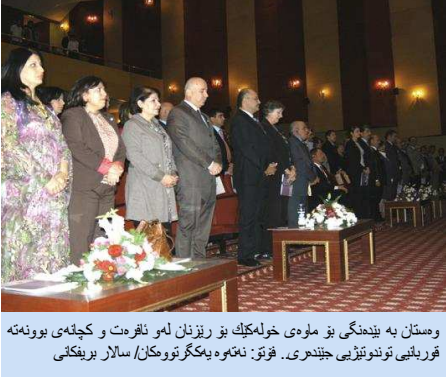
وستان به بیدنگی بۆ ملوی خولهکیک بۆ ریزان لهو ناهرت و کچهی بوونهته قوربانی توندوتیژی جیندهری.