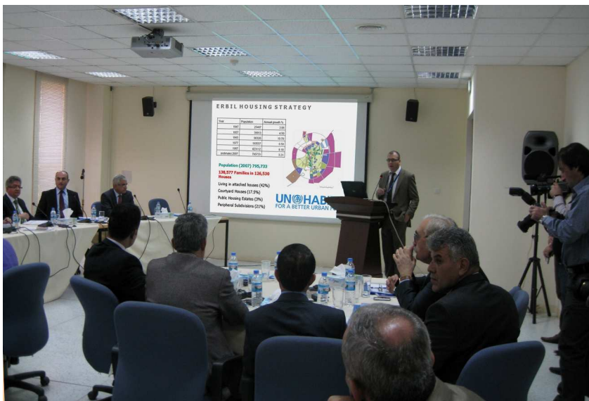
ھابیتاتی نەتەو بە کەرتووەکان لە ۹ و ۱۰ ئی تشرینی نوومی ۲۰۱۰ سەھۆکەریک لە ھولیر سز دیمکەن بە نوێ "باشترکردنی سیستەمی داھێنکردنی خلوو" وێنە بەرنامە عێراقی ھابیتاتی نەتەو بە کەرتووەکان.

لەسەر ئی ھەنگولانەیی کە پێویستە بنزین بۆ کارکردنی تیمی کارکە.