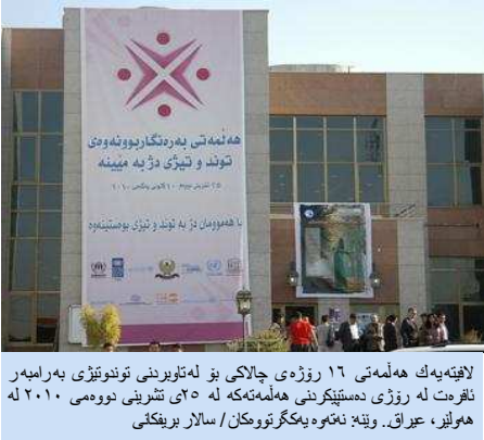
لافتهیهک ههلمهتی ۱۶ رۆژی چالاکای بۆ له تویرندی توندوتیژی بهرامهر ناهرت له رۆژی دهستیپیکردنی ههلمهتهکه له ۲۵ تشرینی دووهمی ۲۰۱۰ له هویز، عیراق.