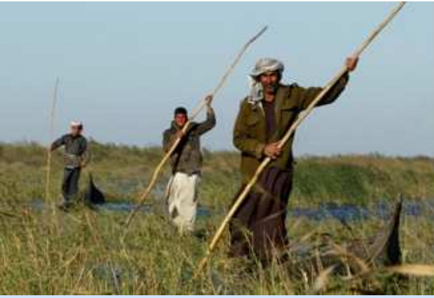
دارمفی نەواری سێستەمی ژینگەیی لە زۆنگۆدەکان بە هۆی شەر و کەمیوونەوێ و دێسەر هێنای حکومی هەر شە لە نەمەنی سەرچۆی بۆیۆی زۆر هۆلەتێیان دیکەن