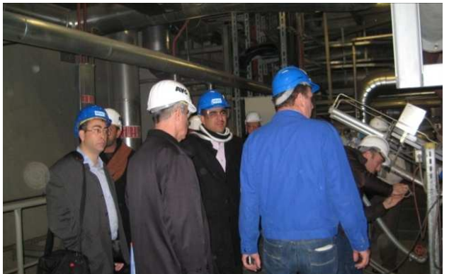
بەرپرسی عیراقی سەردانی دامەزرۆجیەیی لەنوێرینی خاشاک تریسک لە هامبورگ دیکەن.

لە ۱۵ تا ۱۸ تشرینی دوویم لە شاری هامبورگ لە ئەلمانیا، پینچ بەرپرسی بالای حکومەتی عیراقی بە هاوکاری ریکراوی هابیاتی نەتەوێ یە کەرتووەکان بەشداریان لە کۆنگرەیی جیهانیی ۲۰۱۰ بۆ پەرەپێدان و بەر دەوامبوونی شاری کرد. کۆمەلەیی نوودەوێ تیی خاشاک کۆنگرە کە ی ئەمسالی ریکخستبوو کە تێیدا یاس لە ناستەنگە سەرکێبەکانی بەر دەم چارەسەرکردنی خاشاک لە سەدەیی ۲۱ کرد. پینچ بەشدارە عیراقیەکان نوینەرانی