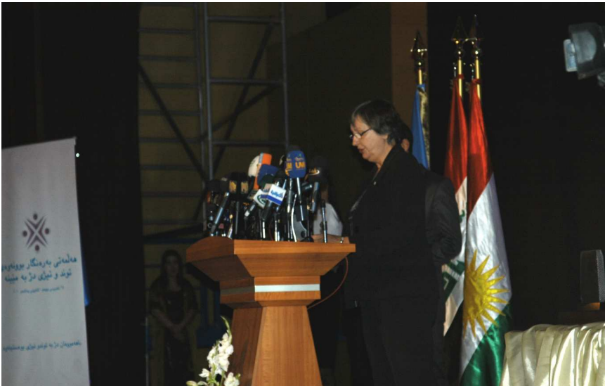
جیگری نوێنەری تایبەتی سکرێتێری گنتی له عیراق / هه‌ماهه‌نگسازى نیشته‌جێ و هه‌ماهه‌نگسازى مرۆبى کرێستین ماکلە له چوارچۆبه‌ی چالاکیه‌کە‌ی دەستپێکردنی هه‌لمه‌تە‌که‌ له هه‌ولێر، عیراق و تە‌مه‌ک‌ پێشکە‌ش‌ده‌ک‌لت تێیدا مه‌یله‌تییه‌ک‌لى نافرەتان و کچنی عیراق به‌دەست توندوتیژی جێبە‌جێ ده‌خه‌له‌ روو. وێنه‌نە‌خۆه‌ر یه‌ک‌گ‌رت‌و‌ە‌کان / سالار برفه‌کی