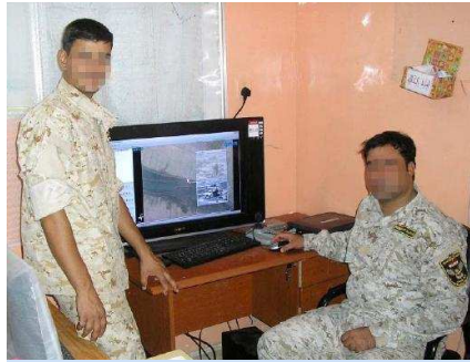
کازمندی ریزی پێشوه‌ی بکه‌ی راهینان له‌بسه‌ره

نامیزی پشکنینی کانزا و نامیزه‌کانی چاودێریکردنی سه‌ره‌کی بۆ چه‌ندین نوسینگه‌ی ده‌سه‌لاتی سنور دابینکران. هه‌روه‌ها ریکخراوی IOM ناماده‌کاری کرد بۆ دامه‌زراندنی ١١ تاوه‌ری په‌یوه‌ندیکردن، له‌گه‌ڵ کرین وگه‌یاندن و دامه‌زراندنی کامیرای نایابی چاودێریکردنه‌ی گه‌رمی بۆ چاودێریکردنی خالی سه‌ره‌کییه‌کانی ده‌روازه‌ سنورییه‌کان. هه‌روه‌ها