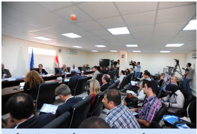
چاودێران لە رایگە یانند و نەتەمە بەگرتووێکان لە مێزگەدە کۆبوونە یە کدا پەرە بە ئاوتۆنکر نەکیان دەدەن