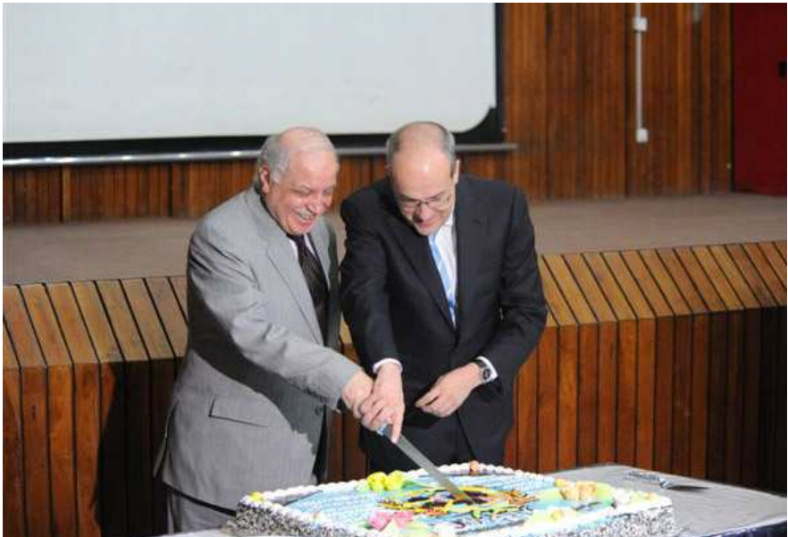
نۆینەری تابیەتی سکر تیری گشتی نەتەمە بەگرتووێکان ئاد مێلگەرت و جیگری وەزیری دەرەو، عەببای، یکی ناھەنگی رۆژی جیھانی نەتەمە بەگرتووێکان لەت دەکەن

لەم رۆژە جیھانییە خۆراکدا، ئێمە ناھەنگ دەگێڕین بۆ ئەو سەکر دایەتی و بەشدارییە بەرچاوەی حکومەتی عێراق لە پێناو دۆزینەوەی چارەسەریکی در ئیخایەن بۆ برسییەتی و بەدخۆراکی . بە ھەر حال، تا ئێستاش زیاتر لە ۲ ملیۆن عێراقی بای ئەوەندە خۆراکیان دەست ناکەوتیت ئیانیکی تەندروستانە بەسەر بەرن بەریز ئیوار کالۆن، بەریوەبەری نوسینگەی عێراقی بەرنامە خۆراکی جیھانی