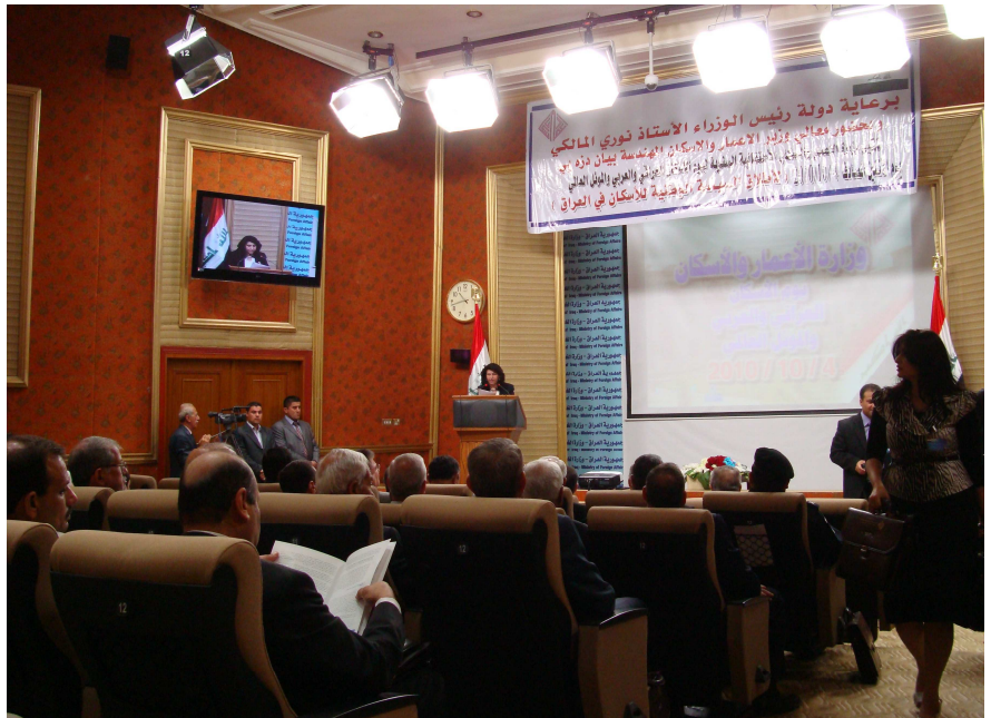
وزیر دژمە ی لە روژی جیهانی هابیتاتدا سیاسەتی نیشتمانی جیکردنی نیشتمانی رادەگەمەنت

بۆ زانباریی زیاتر تکایە پە یووەندی بکە بە شیرین کریکۆریان لە بە رنامە ی هابیتاتی عیراق : sherien.krikorian@unhabitat.org