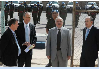
دوا ی دەرکردنی پاسە وانی شەرف و سە لوی پاسە وانی فوجییەکان، گەورە سەرکرایەتی یونانی بەختی جیگری وەزیری دەرەو دەکات