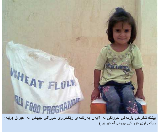
پشکه شکرندی یارمه تی خوراک له لایه بهرنامه ی ریکخراوی خوراک جیهانی له عیراق

"میشکی برسی هه رگیز ناتوانیت ته رکیز بکات و له شی برسی ناتوانیت ههنگاو بنیت و مندالی برسیش هیه نارم زوویه کی بوقه خویندن و یاری کردن نابیت." ئەمه نمو عیراقه راسته قینه یه که له وئ نه ته وه به کگرتو مکان چالاکانه له گه له حکومتی عیراق و هاروبه شکارانی پهره پیدانی تر به شداره له جیه جی کردنی "نامانجی ژماره یه کی پهره پیدانی هه زاره" بوقه لاجوکردنی هه زارایی و برسیهتی له مراد به دهه ههاتنی سالی ۲۰۱۵.