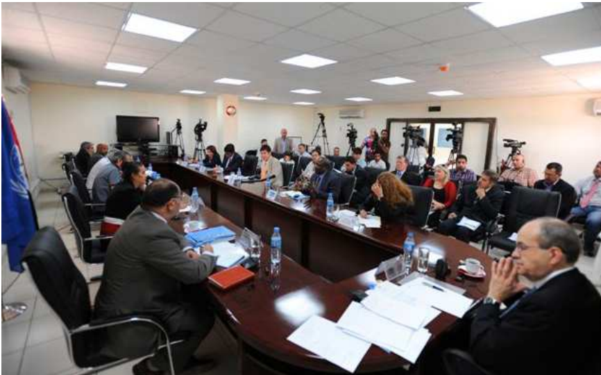
نوێنه‌رانی میدیای عیراقی و به‌ڕێزسانی نه‌ته‌وه‌ی په‌ك‌گرتووه‌كان له میزگرێکی تاووتێکردندا سه‌بارت به روژی جیهانی نه‌ته‌وه‌ی په‌ك‌گرتووه‌كان