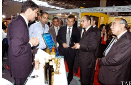
١٠ بازارگننى كاراى عيراقى له خوليكى ريخراوى يونيدوى له تونس بو بازارگانه گنجى كارايمان

نوسينى: كريستيانو پاسينى - يونيدوى عيراق