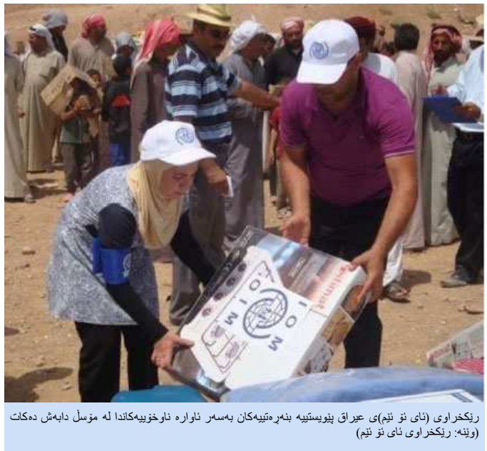
ريخراوى (ناى نو ئيم) عيراق پيوستيبه به ره تيبه كان به سهر ناواره ناوخوييه كاندا له موسل دابهش دهكات

كه هيج شويينكى تر نه بوو رووى لنيكه، نه م خيزانانه ناچار بوون