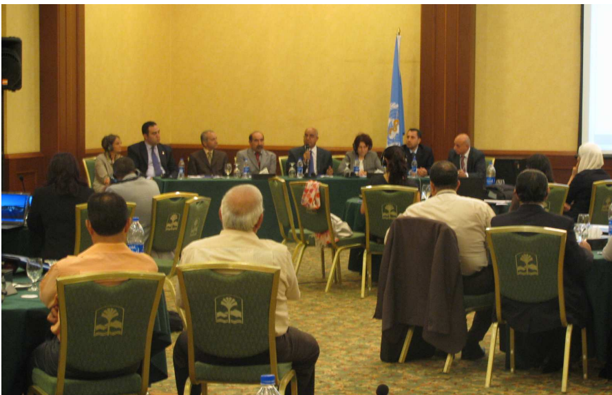
وزیری تهنروستی عیراق د. نعلحسانوی وته پینشکمش دمکات له سه رتانی سه کویکارکه (ویته: ریکخراوی یو نین دی پی، عیراق)

به خشینه کانی "سندوقی جیهانی" سه رچاوه ی سه ره کین بۆ دابینکردنی دارایی دهره کی بۆ عیراق بۆ چالاکیه کانی کۆنترۆلکردنی نه خوشی سیل. نه م به خشینه ش هاوبه شکاریه کی چه ندملیون دۆلاری جیهانی به بۆ دابینکردنی دارایی بۆ بهرنامه نیشتمانیه کانه له پیناو که مکرده وه ی کاریگه ریه کانی نه خوشیه کانی نایدز و سیل مه لاریا له ولاته زۆر توشبوو مگاندا.