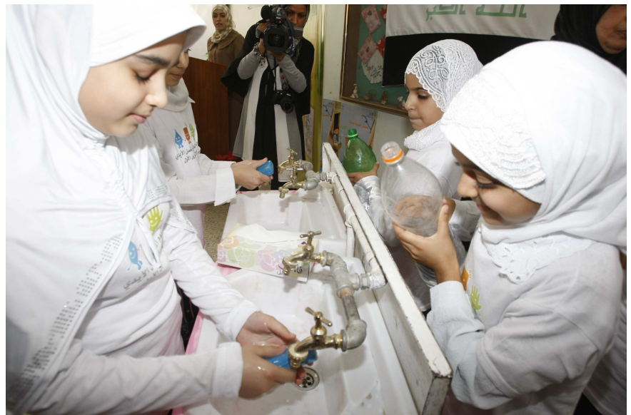
منداڵان یادی رۆژی جیهانی ده‌ستشوتن ده‌کهنه‌ له‌ قوتابخانه‌ی ئه‌مین بێت ئه‌وه‌ هه‌ب له‌ به‌غدا (وێنه‌: یونیسف-سه‌باح ئار- ۲۰۱۰)

بۆ زانیاری زیاتر ده‌رباره‌ی رۆژی ده‌ستشوتنی جیهانی، تکایه‌ سه‌ردانی ئه‌م سایته‌ بکه‌ن: www.globalhandwashingday.org