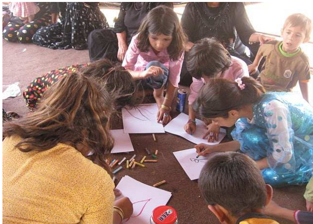
مندالانی ناواره ناوخوبیه کان بیر له سوتانی رهزوباغ و تیکدانی خافو مکان و گونده کانیان دکهموه. ریقه: CSI

جیگری جهختی له سه ر گرنگی سه رزمیری کرده وه وهک نامرازیگ بو گه شه پینان و تهرخانکردنی سه رچاوه و پلاننانی حکومی که ده توانیت پینشگری له گه شه پینانی که رته په روره یه ک بکات که به باشی سه رچاوه ی بو ته رخانکرینیت و ده بیته مایه ی