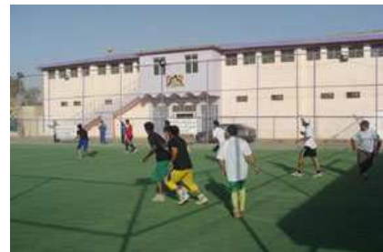
تویی پی له به غداد

رانیا له چه ندان چالاک یی کومه له ی نه مه ل به شدار یی کردوه و خوشترین ده ستی شخه ریش به لای نه وه ره ری کخستنی یاری تویی پی سالی ۲۰۰۹ په که له ژیر ناو نیشانی "له ریگه ی ناشتی به نیمه ولاته که مان بنیات ده نبین و قهیرانه کان چاره سه ر ده که بن" له تیوان گهنجانی دوو کومه لگه ی په یوه ندی نا لوزی به غداد نه نجامدرا. نه و تی "یاری تویی پی له عیراق زور باوه و هیچ شتیک له گه مه و پالو انی به تی دوستانه باشتر نیبه بو یارمه تیدانی خه لک له زانی نه وه ی که ناشتی بو هه موو عیراقیه کان چی