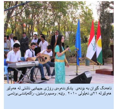
ناھەنگ گۆرانی بە بۆنە ی یادکردنەوہ ی روژی جیھانیی ناشتی لە ھولیز ھولیز لە ٢١ ئەیلوولی ٢٠١٠. وتی: وسیم واستین- راگە یاندنی یونامی