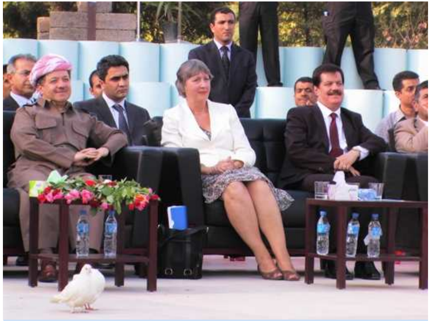
جیگری نوینەری تالیبەتی سکریتیری گشتی نەتەوہ یەکگرتووہکان خاتوو کریستینا ماکناب و سەرۆکی کوردستان مەسعود بارزانی لە یادکردنەوہ ی روژی جیھانیی ناشتی لە ھولیز. وتی: وسیم واستین- یونامی

ئەم ناھەنگە لە لایەن نێردە ی نەتەوہ یەکگرتووہکان بۆ ھاوکاریکردنی عیراق (یونامی) و بە ھاوکاریی تەواوی نوسینگە ی پارێزگاری ھولیز و فەرمانگە ی پە یوہندییەکانی دەرەوہ ی حکومەتی ھەریمی کوردستان ئەنجامدرا. ■