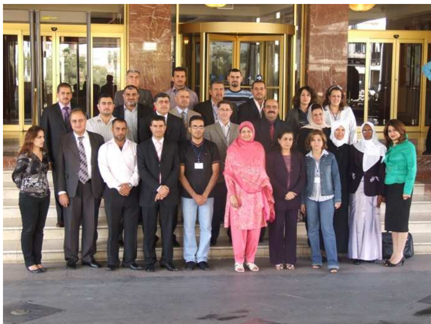
ریکخراو تەندروستی جیهانی و EMRO له‌گەڵ چەند بەشداربوویەکی تر له‌ سەکۆیکاریک له‌ عەمەنی نەردەن لەسەر چوارچێوهی ناناونەکردنی خزمەتە تەندروستیەکان وێنە. ریکخراو تەندروستی جیهانی

پێشبینی دەرکرت راپۆرتی کۆتایی NHA کۆمەلە داتایەکی گشتگر سەبارەت به‌ رەوتی پارەبەخشین بۆ سیستەمی چاودیزی تەندروستی له عیراق دابین بکات وه‌گ سەرچاوه و به‌کارهینانی داراییەکان. ئەم زانیارییانە دەتوانن یارمەتی بریارە‌دەستانی عیراق بەدەن له‌ باش تەرخانکردنی سەرچاوه بۆ چاودیزی تەندروستی. ■