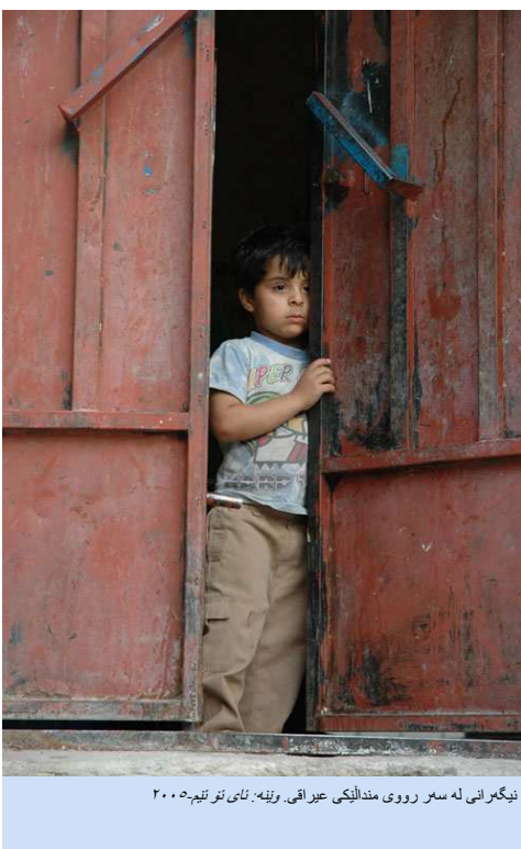
نیگه‌رانی له‌ سه‌ر رووی مندالیکێ عیراقی.

له‌لایه‌کی تریشه‌وه، بریاره‌که‌ داوای دروستکردنی "هیزی کاری و لات بۆ شینواری چاودێریکردن و راپۆرتدان" ده‌کات بۆ نه‌وه‌ی، وه‌ک پێشبینی ده‌کریت، بۆئانیت زانیاری بابته‌ییانه‌ و دروست و متمانه‌دار و له‌کاتیخۆیدا له‌سه‌ر نه‌و ۶ پێشیلکارییه‌ مه‌ترسیداره‌ی دژ به‌ مافه‌کانی مندالانی ناو شه‌ر مه‌کان کۆ بکاته‌وه‌ که بریتین له‌: (۱) کوشتن و په‌که‌خستنی مندالان و (۲)