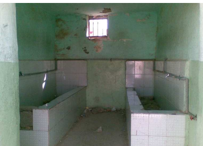
ناو ده ستخانه کانی قوتابخانه ی خواروواق پیش توژ هکر دنه مرجان.

زیاتر له نیوه ی ته وای قوتابخانه کان بی ناو و ناوهرۆی تهندرستن و نهمه ش و دهکات که نه و قوتابخانه ی ناو و ناوهرۆیان هه یه باریان قورس بیت له نجامی به کارهینانی نه مانه له لایه ن ۳ قوتابخانه ی زیاده ی تروه که به توره دوام ده که ن سه رباری روخان و به تالانبردنی قوتابخانه کانی تر.