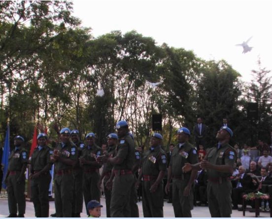
ھەژدانی کۆتری سپی لە یادکردنەوہ ی روژی جیھانیی ناشتی لە ھولیز. وتی: وسیم واستین- یونامی

پارێزگار نەزاد ھادی وێرای دە ستخوشیکردنی لەم یادکردنەوہ یە لە شاری ھولیز و خواستنی ھیوای