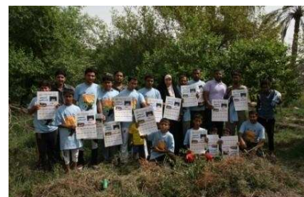
وێنە ھۆر: گەنجان و منداڵان بەشدار لە ھەمەمی خویندەواری لە ھۆر مەکاندا دەکەن.

بۆ بەرھەنگاربوونەوێ ئاستەنگەکانی بەردەم خویندەواری، حکومەتی عیراق کتیبی نوێی