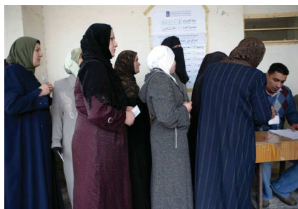
ژنه‌ ده‌نگه‌رە‌کان ناوی خۆیان له‌ بنکە‌ی تۆمارکردنی به‌غداد تۆمار دە‌کە‌ن.

به‌ بۆنه‌ی سێهه‌مین ناهه‌نگ‌گه‌رانی رۆژی جیهانی دیموکراسی که له‌ سەر‌تاسه‌ری جیهاندا له‌ رۆژی ۱۵ی یه‌یلول ئه‌نجام یاد ده‌کرێتە‌وه، نوینه‌ری تاییبە‌تی سکرته‌یری گشتی نه‌ ته‌ وه‌ یه‌ کگرتووه‌ کان ئاد میلکه‌رت په‌ یامکی ناراسته‌ی خه‌لك و سەر‌کرده عیراقیه‌کان کرد که تێیدا به‌ ریزی پێداگری کرد له‌سەر ئە‌وه‌ی که دیموکراسی ۳ چەمکی بناغه‌یی له‌ خۆ ده‌گریت که "یه‌که‌میان بریتیه‌ له‌ داننان به‌وه‌ی که له‌ هەر شوێنێک خه‌لك کۆمەلگاکان به‌ یه‌که‌وه‌ ژيان نه‌وه‌ شه‌ری به‌ژ وه‌ه‌ندی ده‌ست پێده‌کات که نه‌ویش پێویسته‌ به‌ شیوه‌یه‌کی ناشتیانه‌وه‌ له‌سەر بنه‌مای یاسا چاره‌سه‌ر بکریت. دووه‌میش بریتیه‌ له‌ مافی هەر تاکێک له‌ هه‌ لێژاردنی حکومه‌ت و شیوازی حوکمکردن که پشت نه‌ستوو به‌ مافه‌ ره‌واکانی وه‌گ نازایی راده‌ رېرین و به‌ په‌ که وه‌ بوون و