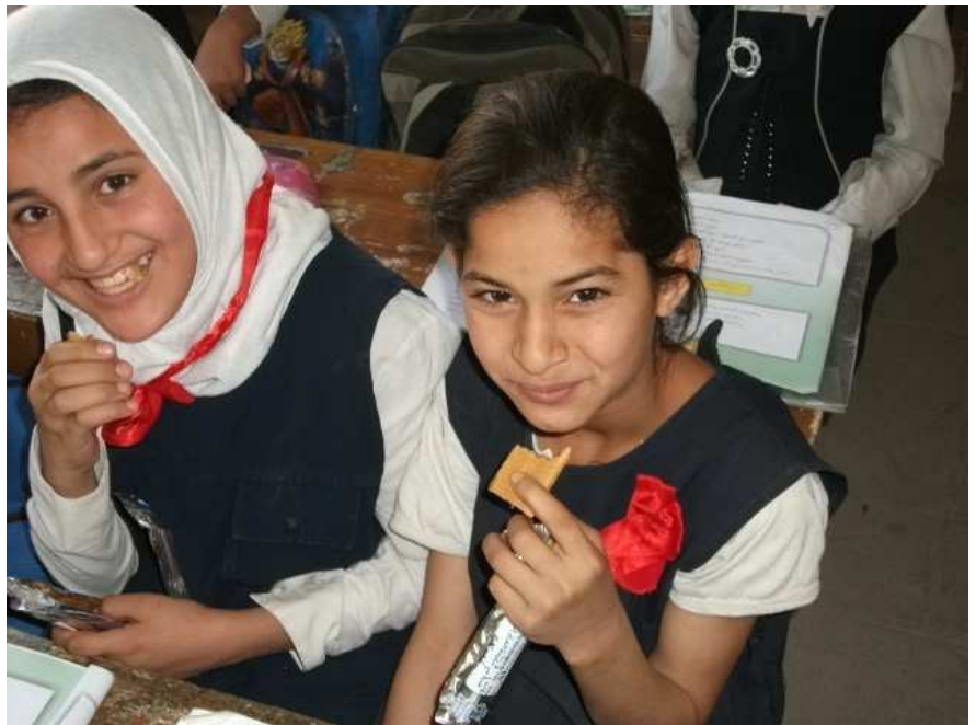
کچانی قوتایی لە بلقوبە و ناوهراستی عێراق چیژ لە خورما بۆ نانی بەمیان و هردەگرن .

کارمە ندانی وەزارە تی پەروەردەش پەره پێدەدا بۆ ئەو ی بەرنامە کە لە مانگی ئە یلولی ۲۰۱۱ بۆ حوزەیرانی ۲۰۱۲ و دواتر جێبە جێبکات.