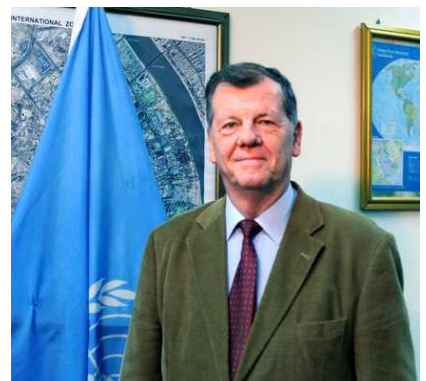
جیگری تازه دامه زراوی نوینه ری تایبه تی سکرتری گشتی نه ته وه یه کگر تو وه کان جیگری سکورا توویکز. ریقه: سه رمان نلسانی- یونامی

له سه روبه ندی ناماده کاریبه کان بو سه رزمیری داهاتوو، جیگری نوینه ری تایبه تی سکرتری گشتی نه ته وه یه کگر تو وه کان جیگری سکورا توویکز له کویونه وه ی فراوانی عیراقی که له ۲۲ ی نه یلول سه باره ت به سه رزمیری دانیشتوانی ۲۰۱۰ له ناو نهنجومانی وه زیرانی به غداد که به ناماده بوونی سه رهک وه زیران نوری مالیکی نهنجامدرا وته یه کی پینشکه ش کرد.