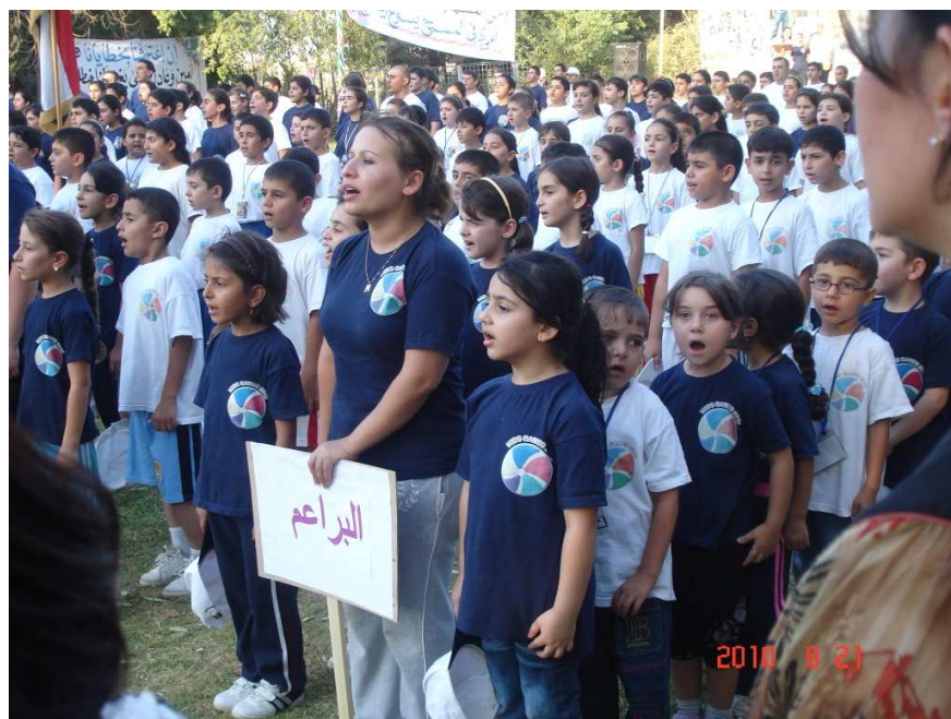
گهنجیکی کهرکوک له چالاک یی پالووانی به تی گورانی بو ناشتی ده لیت

له که شیکی پر پیکه نبین و خوشی و ته بابیدا چه ندان چالاک یی جزراوجور هه ر له پالووانی به تی وهرزی و نوسراوی قوشمه و هوزراوه چیرۆک گیزانه وه تا ده گاته کۆبوونه وه ی په روه ردی له سه ر سه ریاسی ناشتی و نارامی و گه شه پیدان و ناوه دانکردنه وه نه نجامدرا. له ریگه ی کارکردن له تبه کانی شه وه، منداله کان فیزی به های په کریزی و لیبورده یی کران. نه وان له رنی به شدار یی چالاکانه وه به شدار ییان کرد له نیلهام به خشین بو گفتوگوکردن سه باره ت به وه ی که چون ناشتی و په روه رده و ناسایش ده توانن یارمه تی گه شه پیدان بده ن و هه له کانی ش زیاد بکه ن. هه ندی له قوتابیان هیوای نه وه یان خواست که له ناینده دا بینه نه ندازیار یان ماموستا یان پزیشک یانیش په رستیار بو نه وه ی، به وته ی خو یان، "بتوانن یارمه تی هه زار و نه خوش و به سالآچوو ان بده ن و ولاته که شمان دروست بکه ن. سالی دادیت به بیروکه ی نو یوه دینیه وه بو نه وه ی هاو به شیان بکه ن له گه ل نهو هاوریانه مان که نه مرۆ لیره ناشنایان بووین." ■