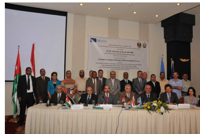
خولی راھێنان تالیبت بە ستافی سەختەری نیشتمانی عیراکی بۆ گواستەوێ خوین، لە ھەممەن. وێنە: ریکخراوی تەندروستی جیھانی

وەزارەتی تەندروستی عیراق بە ھاوکاری ریکخراوی تەندروستی جیھانی و فەرمانگە بانکی خوینی ئەردەنی لە ١٩ ئیلوولی ٤ خولی راھێنانی دەستپێکرد بۆ ٥٠ کادری تەندروستی عیراکی کہ لە ناوھندی نیشتمانی عیراکی بۆ خوین گواستەوێ و بانگە ھەرێمەکانی خوین کار دەکەن. چوار خۆلەکی راھێنان کہ ھەر بەکەیان ٣ ھەفتە بوون ئامانجیان زیاترکردنی بە ھەر تەکنیکی و بەرێوەبەراییەکانی پیشەگەرە عیراقییەکان بوو بۆ دەستپێکردنی سەلامەتی خوین و بەر ھەمەکانی و بۆ باشتر بەکارھێنانی خوین بۆ تەندروستی ئەخۆش.