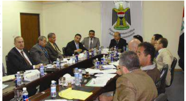
گروپی کار بۆ کورنوه ی هاو به شکی سیاستمداران تایهت به باج - به عدا، نیسانی ۲۰۱۰.

خوتیهه ل فور تاندنی له سه ر ناستی نیشتمانی و پاریزگادا نه جامده دات. له سه ر ناستی نیشتمانی، به رنامه که پشتگیری له سیاستی نیشتمانی ده کات له پیناو پیکه پیدانی که شیک هاندەر بۆ گه شه پیدانی کهرتی تایهت. له سه ر ناستی پاریزگاشدا، به رنامه که له وه دنیای دبیت که گرفته کانی به رده م پیشکه وتی که رتی تایهت له ریگه ی پلاندانان و جبهه جیکردنی چالاکیه کانه وه له ۳ پاریزگای نه زمونیدا له بهر چاو گیرا وون.