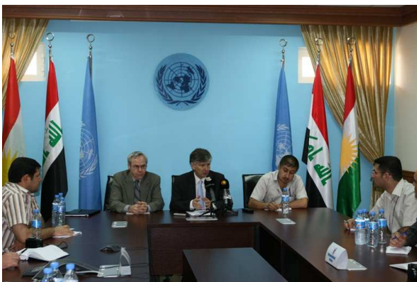
نوینهری سکریتیری گشتیی نه‌ته‌وه یه‌کگرتوو‌ه‌کان کالین له‌ کونگره‌یه‌کی روژنامه‌وانی که له‌ ۳ی تشرینی یه‌که‌می ۲۰۱۰ له‌ باره‌گی یونامیی هه‌ولێر به‌سترا هه‌و بۆ راگه‌یاندن ده‌کات.

به‌ریز کالین هانی حکومه‌تی کوردستانی دا بۆ په‌ره‌دان به‌ پلانیکێ گشتگیری درێزخایه‌ن به‌