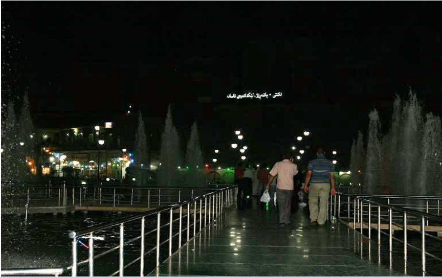
ناستی • به‌هێزێتی ئه‌گه‌یه‌ی هه‌ولێر