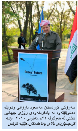
سەرۆکی کوردستان مەسعود بارزانی وتاریک دەخوینتەوہ لە یادکردنەوہ ی روژی جیھانیی ناشتی لە ھولیز لە ٢١ ئەیلوولی ٢٠١٠. وتی: کۆمیساریای بالای پەناھەندەکان- ھیلینە کۆکس