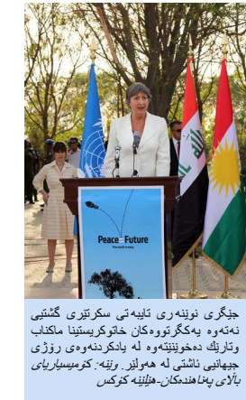
جیگری نوینەری تالیبەتی سکریتیری گشتی نەتەوہ یەکگرتووہکان خاتوو کریستینا ماکناب وتاریک دەخوینتەوہ لە یادکردنەوہ ی روژی جیھانیی ناشتی لە ھولیز. وتی: کۆمیساریای بالای پەناھەندەکان- ھیلینە کۆکس