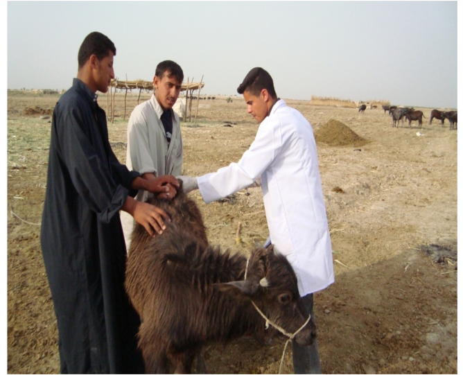
منتدى ذي قار ذي قار أبريل/نيسان 2009

المقالة الكاملة موجودة على www.uniraq.org/publication/focus/April 2009