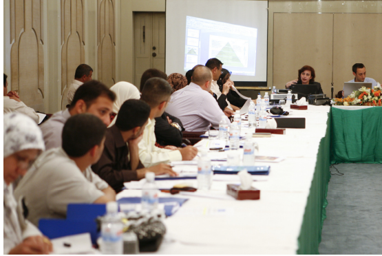
ريك باجورناس: بعثة الأمم المتحدة للمساعدة في العراق

النتائج مثل كيفية تخطيط وتشكيل المؤشرات بالاعتماد على مراقبة الأداء وكيفية تحديد النتائج المعتمدة على المعرفة بالإضافة إلى مناقشة آليات كتابة التقارير.