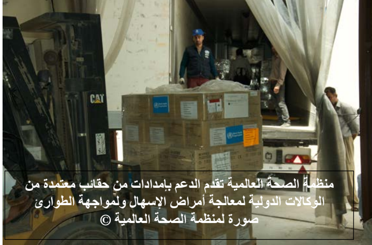
منظمة الصحة العالمية تقدم الدعم بإمدادات من حقائب معتمدة من الوكالات الدولية لمعالجة أمراض الإسهال ولمواجهة الطوارئ