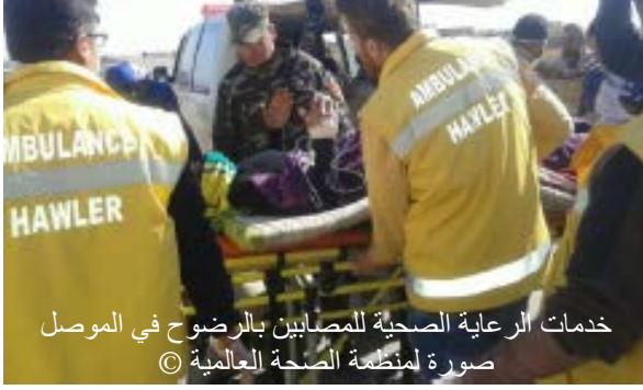
خدمات الرعاية الصحية للمصابين بالرضوح في الموصل

■ ستسحب مديرية الصحة في نينوى القوى العاملة الصحية من مراكز الرعاية الصحية الأولية في "شام حسن"، و"خازير"، ومخيمات "الدباغة"، وتترك مسؤولية توفير الرعاية الصحية الأولية لمديرية الصحة في أربيل.