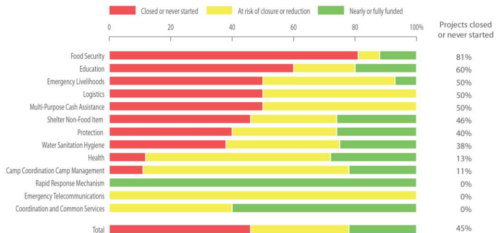
PROJECT STATUS BY CLUSTER

بۆ زانیاری زیاتر، تکایه په‌وه‌ندی بکهن به: