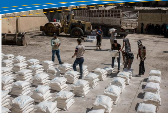
تەموزی ۲۰۱۷ مافی پارێزراوە لەلایەن رێکخراوی یونیسێف/لەلایەن جێنێز یار