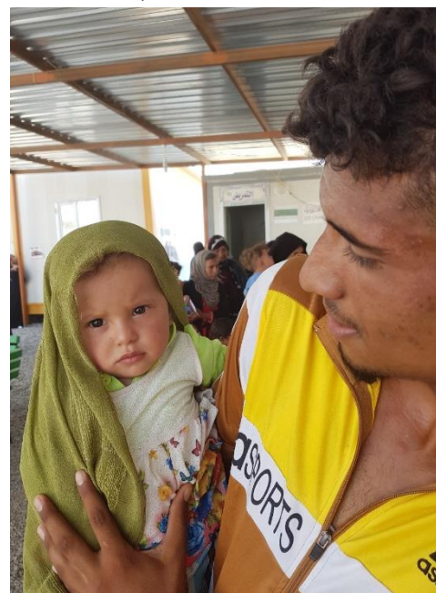
له‌لایه‌ن: ئوچا/ده‌مید و ایت

بۆ ئه‌وه‌ی هاوکاری ئاواره‌کان بکهن و تییگهن له‌ هۆکارانه‌ی که‌ به‌شداری ده‌کهن له‌ بریاردانی خه‌مکی له‌ مانه‌وه‌ یان گه‌رانه‌ویان بۆ ماله‌وه‌، لیکۆلینه‌وییه‌کی مه‌به‌ستدار له‌ رینگه‌دايه‌. نموونه‌یه‌کی دیاریکراوی سه‌رۆک خێزانکه‌نی ئاواره (نزیکه‌ی ۴,۷۲۱