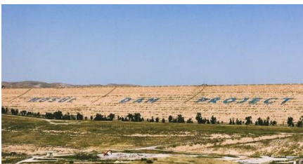
سه‌ر چاوه: ئوچا به‌نداوی موسل

له رۆژی ٢١ ی حوزمه‌یران، به‌ر پرسانی عیراقی و ئیتالی و ئەمه‌ریکی نۆژمه‌نکردنه‌وه‌ی به‌نداوی موسلیان به‌ کۆتا هه‌ینا به‌ بری ٥٣٠ ملیون دۆلاری ئەمه‌ریکی که بو ماوه‌ی سێ سالی خایاند. به‌نداوه‌که — که گه‌وره‌ترین به‌نداوه‌ی عیراق و له نیوان گه‌وره‌ترینه‌کانه له رۆژه‌لاتی ناوهراسه — شوینه‌که‌ی به‌ درێزایی روه‌باری دیجه‌یه ٢٥٠ میل له به‌غداوه‌ دوره. به‌نداوه‌که ٣٧١ پین قوله و ٢,١ میل درێزه و به‌ درێزایی ٣٣ سالی میژوو مکه‌ی کۆمه‌کی ناو و کشتوکالی و کۆنترۆلی لافاوو و کاره‌با‌ی دا‌بین کردوه. هه‌ر چه‌نده، له سه‌ر بنچینه‌یه‌کی جیۆلۆجی بنیاتنراوه له‌گه‌ل چینه‌کانی گه‌یج، ناویکی تهاوه، و به‌هۆی ئەم پیکه‌اته‌یه، که په‌یووستی به‌ چاککردنه‌وه‌ی به‌ر ده‌وام هه‌یه تاكو دانهر مه‌یت له‌و کاته‌ی که بنچینه‌که دا‌ده‌خوړیت. دا‌عه‌ش ده‌ستی به‌ سه‌ر به‌نداوه‌که دا‌گرت بو ماوه‌ی دوو هه‌فته له سالی ٢٠١٤، و هه‌ر چه‌نده به‌ خه‌یرایی ئازادکرا، چه‌کدار مکه‌ن زبانیان گه‌یاند به‌ ئامه‌ر، که‌ل و په‌له‌کانیان دزی و به‌ ناچاری کاری چه‌مه‌نتۆکردن بو چه‌ندین مانگ تیا‌یدا وه‌ستا. نیکه‌رانی له‌باره‌ی سه‌قامگیری به‌نداوه‌که گه‌شه‌ی سه‌ند، و هه‌یزی کاری فره‌ نه‌توه بو به‌نداوی موسل له ئه‌یلولی ٢٠١٦ ده‌ستیان به‌ کار کرد، له کۆتاییدا له حوزمه‌یرانی ٢٠١٩ کاره‌که‌ی ته‌واو بوو، هه‌ر چه‌نده کاری چاککردنه‌وه به‌ر ده‌وام ده‌ییت تیا‌یدا.