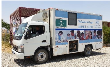
سه‌رچاوه: ئوچا/له‌لایه‌ن یوقیت کراقتی، نۆرینگه‌ی گه‌رۆک هاوکاری کراوه‌ له‌لایه‌ن سندوقی مرۆیی عێراق؛ خێوتگه‌ی تازه‌ دێ بۆ ناوارمکان، له‌سه‌لمانی، (حوزمیرانی ٢٠١٩).

دۆزینه‌مه‌کانی ئه‌م دواییه‌ی کاروانی هه‌لسه‌نگاندنی سندوقی مرۆیی عێراق بلاوکراوه‌تمه‌وه. هه‌لسه‌نگینه‌ران سه‌ردانی عێراقیان کرد له‌ رۆژانی ١٠ تا ٢١ حوزمیران و چاوپێکه‌وتنیان نه‌نجام دا له‌گه‌ڵ کۆمه‌که‌خشان و ناژانسه‌کانی نه‌تمه‌ به‌کگرته‌وتومه‌کان و رێکخراوه‌ ناخۆمه‌یه‌کان (ناوخبۆی و نیشتمانی و نیوده‌وله‌تی) و گه‌روه‌یه‌کانی جه‌ختکراوه‌ له‌ نه‌ندامانی کۆمه‌لگا. دۆزینه‌وه‌ سه‌ره‌کيه‌کان له‌وانه‌ سندوقی مرۆیی عێراق به‌شداری کردنیکی گه‌رنگی هه‌بووه‌ له‌ دنیایی دان له‌ به‌هانوه‌چوونیکێ کاتی و کاریگه‌ر، و به‌ره‌پێشوه‌چوونه‌کان هه‌بوون له‌ به‌کاره‌ینانی ستراتیجی پالېشتیه‌ داراییه‌کان له‌ ساڵی ٢٠١٧ به‌ره‌وه‌ داوه‌، هه‌رچه‌نده‌ فشار هه‌بووه‌ له‌سه‌ر سندوقه‌که‌ تاكو به‌هانای کۆمه‌لێک له‌ کاره‌ له‌پێشینه‌کانه‌ به‌جێت. به‌ شێوه‌یه‌کی گه‌شتی، هه‌لسه‌نگینه‌ران ئه‌وه‌ میان دۆزیه‌وه‌ که هاوکاریه‌کی فراوان هه‌بووه‌ بۆ هه‌ولێ زیاتر تاكو گه‌نده‌لی به‌گه‌ڕێ و بناسینداریت، به‌لام تیبینی ئه‌وه‌ میان کرد که هه‌وله‌کانی له‌م چه‌شنه‌ کاریگه‌ری ده‌ییت بۆ جیه‌به‌جیه‌کردنی سندوقی مرۆیی عێراق و سیسته‌می فراوانتری مرۆیی له‌ عێراق. هه‌لسه‌نگاندنه‌که تیشکی خسته‌ سه‌ر بارگه‌رژیه‌کان له‌ هاوکاری کردنی سندوقی مرۆیی عێراق بۆ پابه‌ندیه‌کانی رێکه‌هوتنی گه‌وره‌ سه‌بارته‌ به‌ خۆمالی کردن و به‌ره‌پساریتی و له‌به‌ر چاوه‌گرتنی به‌ریوه‌بردنی مه‌ترسی.