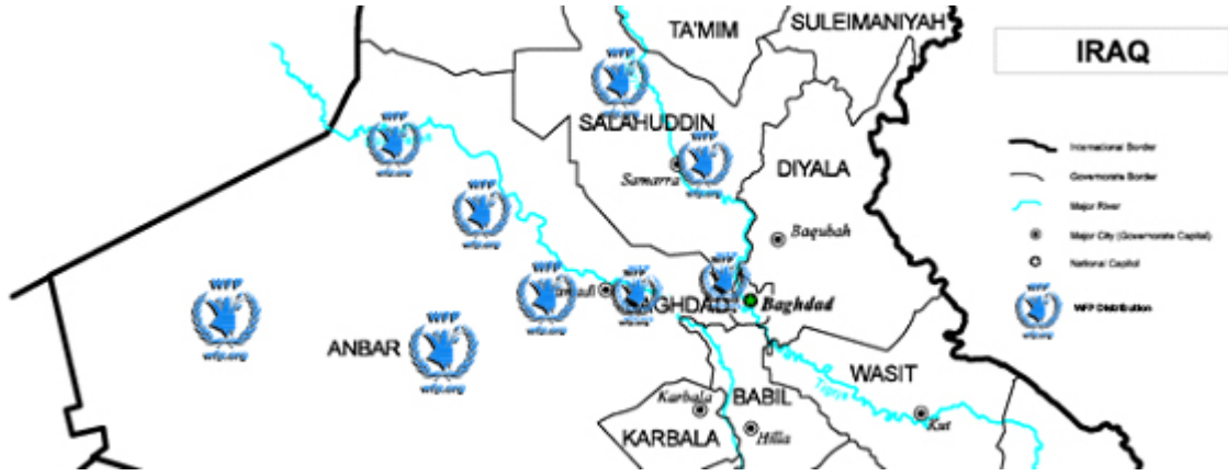
الخارطة من برنامج الأغذية العالمي في العراق، شهر أيار 2014

تخطط منظمة الأمم المتحدة للطفولة (اليونيسيف) لتوزيع 2000 رزمة غذاء عالي البروتين بين النساء اللاتي لديهن أطفال تحت سن خمس سنوات في منطقتي الخالدية وأبو غريب. وستحوي الرزم التي سيتراوح وزنها بين 4-5 كغم: كيلوغراماً واحداً من العدس وكيلوغراماً من الفاصوليا وبسكويت عالي البروتين وجبن وعصير.