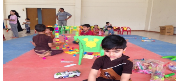
الصورتين بعنسة اليونيسيف: النشاطات الترفيهية في الفضاءات الصديقة للطفل التي تقيمها اليونيسيف