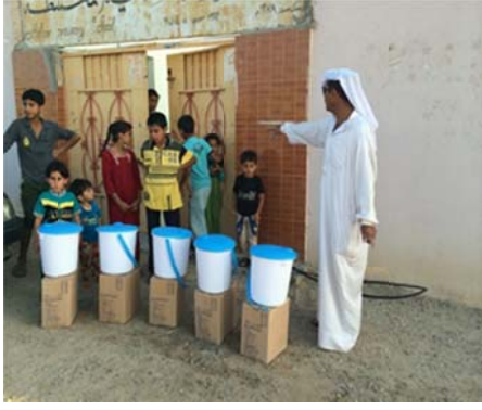
صورة خاصة باليونيسيف: توزيع إمدادات المياه والنظافة والصرف الصحي في الخالدية في محافظة الأنبار

تم توزيع مستلزمات النظافة الصحية والمواد العائلية على 3700 أسرة (22200 نازح) في مناطق الرمادي وهيت والحبانية والخالدية والعنكور، ويستمر تأمين نقل 320500 لتر مياه يومياً باستخدام الناقلات الحوضية لسد احتياجات 17406 نازح في