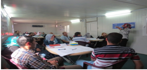
تدريب عن الفضاءات الصديقة للطفل

فرق مجتمعية من الرطبة وحديثة والحبانية. وقد تم اعتماد ما مجموعه 15 شخصاً لتشغيل الفضاءات الصديقة للطفل، مع التركيز على نحو خاص على التعامل مع الأطفال في حالات الطوارئ.