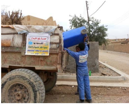
حملة جمع النفايات والتخلص منها في القائم/محافظة الأنبار

هيت والرطبة والقائم والحبانية، وتم توزيع المياه على 280 أسرة بواقع (1680) نازح في مدينة الحبانية.