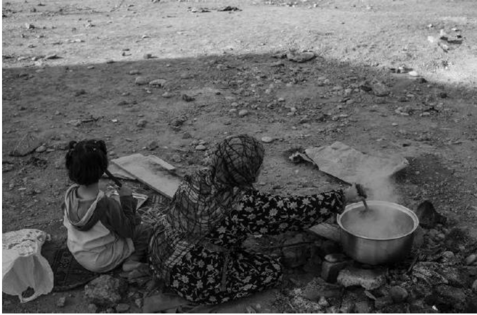
امرأة لاجئة من دير الزور شرق سوريا مع حفيدتها تطهي في الخلاء بمنطقة للنفايات في أربيل بالعراق.