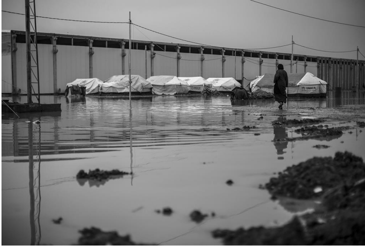
بارانى بەخور لە خپۆتەنگەى ئاوارە ناومخۆببەكانى بەحرەكە لە ھەولێر لە ھەرتەمى كوردستانى عىراق نووسینگەى ھەماھەنگى بۆ كاروبارى مرۆيى/ ئانسۆن ئەشانەسباس