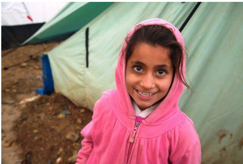
كچىكى ئاوارەى ناومخۆيى لە خێوتگەپەك لە پارێزگای دەۆك لەلایەن نووسىنگەى ئۆتچا/دەپقید سوانسۆن

نەوت بۆ چىشتلێنان و خۆ گەرم كردنەوه وەكو نىگەرانیەكى گەمەرە دەمىننیتەوه. بۆ یارمەتیدانى پرکردنەوى بۆشاییەكە، ھەندى لە ھاوکارانى مەروىی كۆمەكى دەكەن لە دابەش كردنەكانى حكومەت بە دابین كردنى ھاوکارى نەوتى ئامانجكراو بۆ خیزانە ھەزارەكان. حكومەت نەوتى بۆ زياتر لە ۳۵۰۰ خیزانى ئاوارەى ناومخۆيى دابەش كردوو لە پارێزگایانى باشور (لە بەسرە و مېسان و موثنى و قادسیە و زىقار)، زياتر لە ۶۴۰۰ خیزانى ئاوارەى ناومخۆيى لە پارێزگایانى ناومرەست ( لە بابل و بەغدا و دىالە و نەجەف و واسىت) و زياتر لە ۱۵۷۰۰ خیزانى ئاوارەى ناومخۆيى لە ھەرمى كوردستانى عىراق ( لە دەۆك و ھەولێر و سلیمانى)، دەستى گەشتوو بە نزيكەى لەسەدا ۷ كۆى ژمارەى خیزانانى ئاوارەى ناومخۆيى لەسەر تاسەرى عىراق. ھاوکارانى مەروىی نەوتیان بۆ زياتر لە ۹۰۰۰ خیزانى ئاوارەى ناومخۆيى دابەش كردوو لە پارێزگایانى ناومرەست لە (دىالە و كەركوك) و زياتر لە ۲۳۰۰۰ خیزانى ئاوارەى ناومخۆيى لە ھەرمى كوردستانى عىراق لە (دەۆك و ھەولێر و سلیمانى)، دەستیان گەشتوو بە لەسەدا ۹ زياترى خیزانانى ئاوارە ناومخۆییەكان لەسەر تاسەرى عىراق، بۆ كۆى پرکردنەوى نەوت بۆ لەسەدا ۱۶ى حالەتەكانى ئاوارە ناومخۆییەكان.